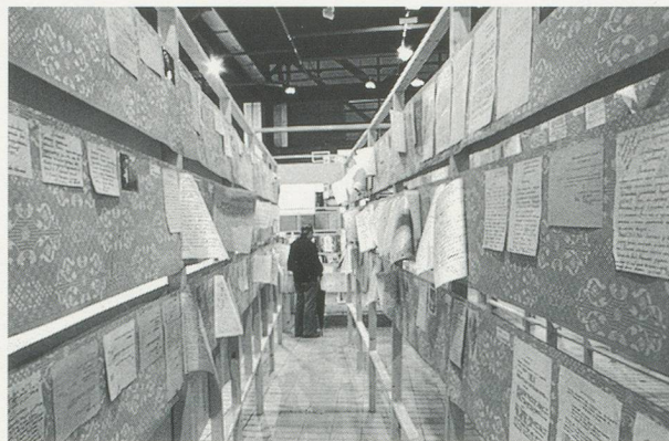
ILYA KABAKOV, THE SHIP / DAS SCHIFF , 1986, installation Flac. Lyon.

Its climax was an end wall on which dozens of visitors' comments were arranged as framed texts, grouped around a depiction of a fly. The comments