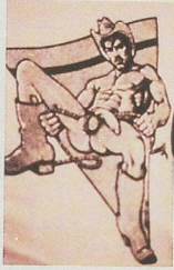
RICHARD PRINCE, COWBOY AND GIRLFRIEND, 1987, Ektacolor print, 86 x 47" / 218,4 x 119,4 cm.