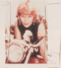
My girl friend My boy friend's My wife