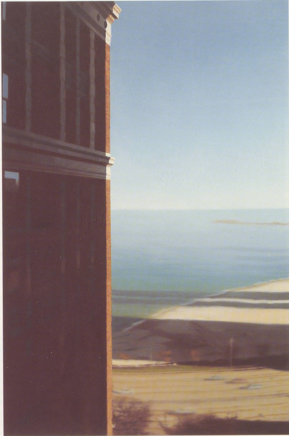
GERHARD RICHTER, CHICAGO, 1992, Öl auf Leinwand, 122 x 82 cm / oil on canvas, 48 x 32¼". (Absichtlich seitenverkehrt reproduziert / reproduction intentionally reversed).