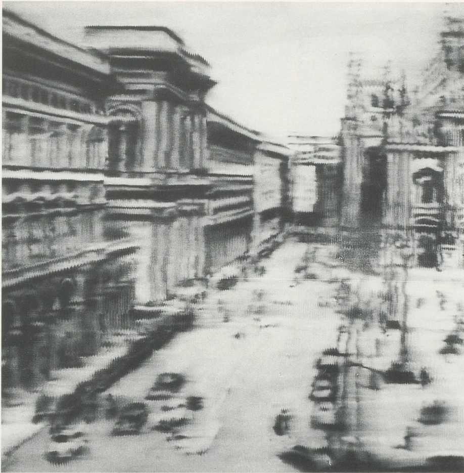
GERHARD RICHTER, DOMPLATZ, MAILAND, 1968, Öl auf Leinwand, 275 x 290 cm / CATHEDRAL SQUARE, MILAN, 1968, oil on canvas, 108¼ x 114⅞".

einer neuen Rhetorik der Gewissheit niederschlug. In der bildenden Kunst wurden jene alten Kategorien malerischen Ausdrucks, die man im 17. und 18. Jahrhundert so leidenschaftlich beschworen hatte, durch Gerhard Richter und Andrew Warhola im Zustand des absoluten Zweifels wieder aufgenommen. Sie gingen dabei von der Vorstellung aus, dass, solange der Zweifel Wirkung tut und die daraus resultierende Malerei ihn bestätigt, er sich weder in Verzweiflung auflösen noch zu monadischer Gewissheit wandeln könne, sondern immer eine absolute Chance bliebe.