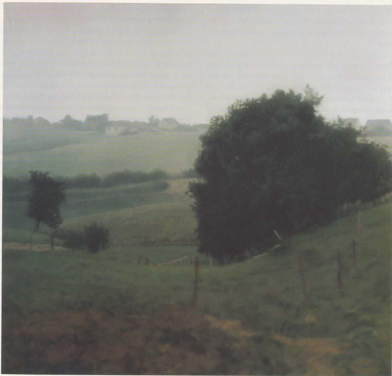
GERHARD RICHTER, WIESENTAL, 572-4, 1985, Öl auf Leinwand, 90 x 95 cm / oil on canvas, 35½ x 37⅞".