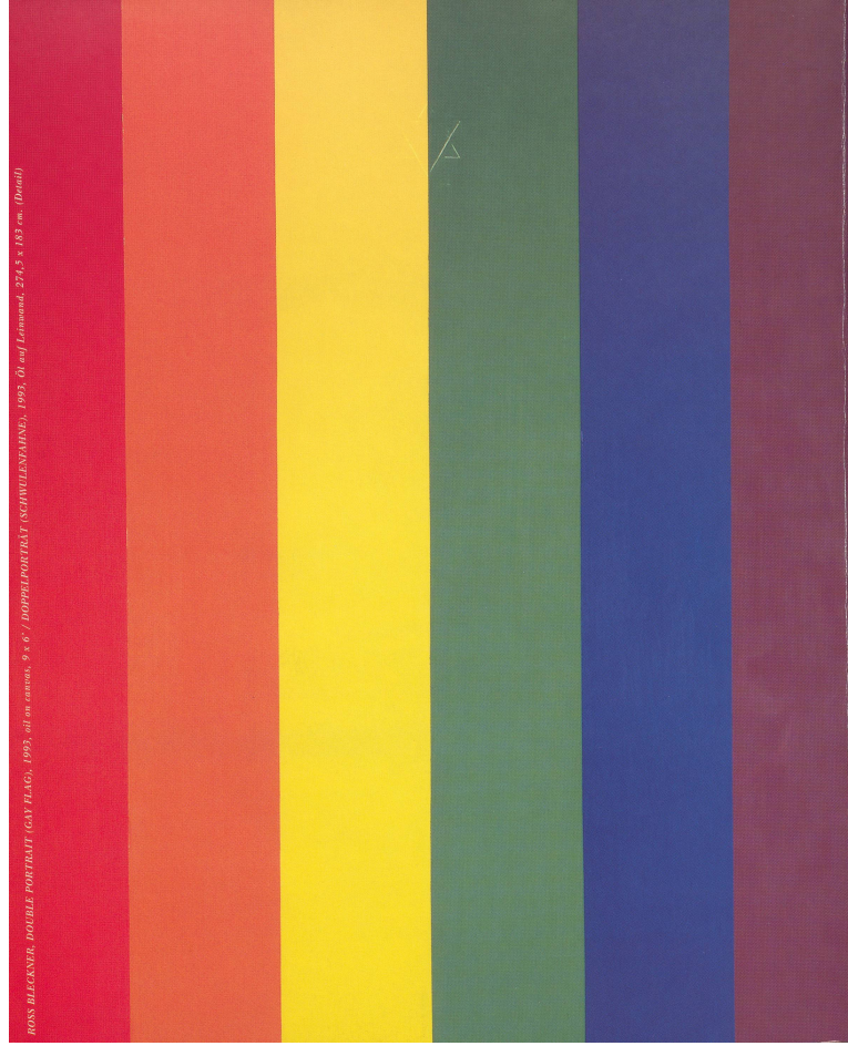
ROSS BLECKNER, DOUBLE PORTRAIT (GAY FLAG), 1993, oil on canvas, 9 x 6 / ДВОЙНОЙ ПОРТРЕТ (СОБЛЮЖЕНЦАМ), 1993, масло на холсте, 27,5 x 18 см. (Detail)