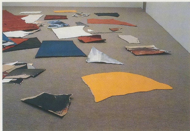
ADRIAN SCHIESS, FETZEN, 1984,

stimmtes visuelles Angebot an die gegebene Architektur darstellen: Das Konzept der Komposition soll auch nicht durch die Hintertüre ins Spiel kommen. Damit wird die Architektur auf ihre eigenständige Qualität verwiesen, der sich der Künstler nur bedient, um das Werk zu zeigen, das am Ende nicht mehr und nicht weniger sein will als eine im Ansatz grenzenlose Ausbreitung von Farben. Hinter diesem Vorgehen verbirgt sich nicht zuletzt auch ein grosser