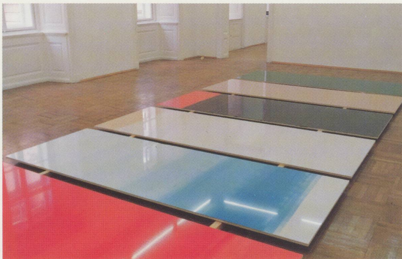
ADRIAN SCHIESS, 6 FLACHE ARBEITEN, 1990, Autolack auf Verbundplatte, je 110 x 300 x 2 cm / 6 FLAT WORKS, 1990, car paint on composition board, 43 \frac{3}{8} x 118 x \frac{3}{4} " each.

Kunstwerke, die weder die vielbeschworene Autonomie für sich behaupten, noch als Illustrationen eines formalen Systems und auch nicht als Ausdruck eines ideologischen Programms funktionieren wollen. Damit ist allerdings keine modische Unverbindlichkeit gemeint, denn wenn man sich der Sache auf der visuellen Ebene vorbehaltlos annähert, offenbart sich aufgrund der konkreten Präsenz und der selbstverständlichen Ausstrahlung dieser Werke eine sehr klare künstlerische Haltung. Freiheit und Offenheit sind hier nicht einfach nur Schlagworte, sondern verbindliche Prinzipien, die sich auf den verschiedensten Erscheinungs- und Wirkungsebenen des Werks manifestieren.