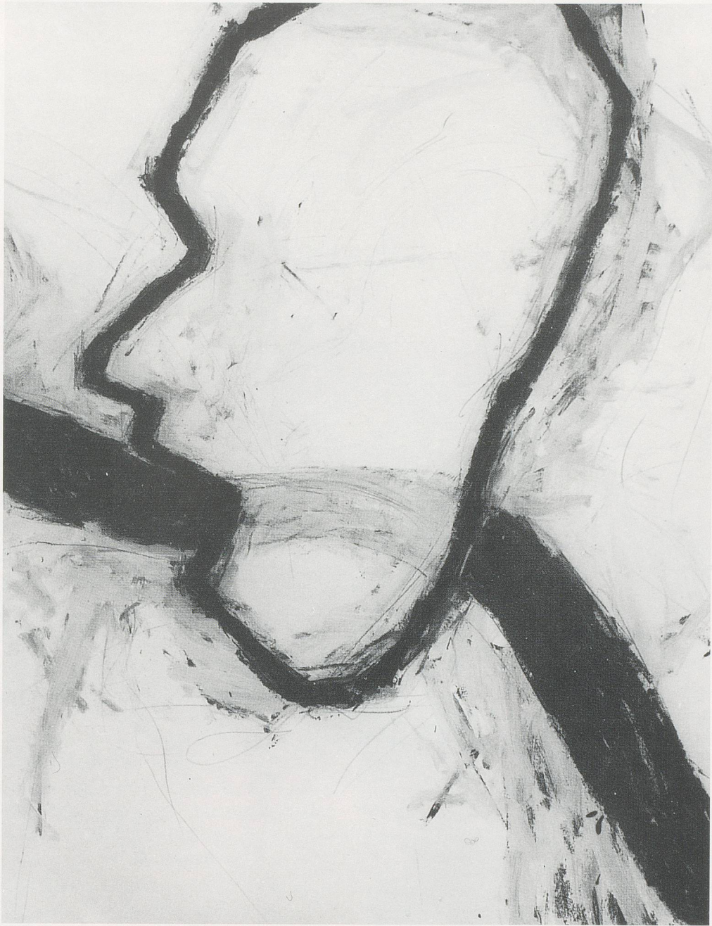
SUSAN ROTHENBERG, UNTITLED, 1978, acrylic and flashe on paper, 50 x 38½" / OHNE TITEL, 1978, Acryl auf Papier, 127 x 96 cm.