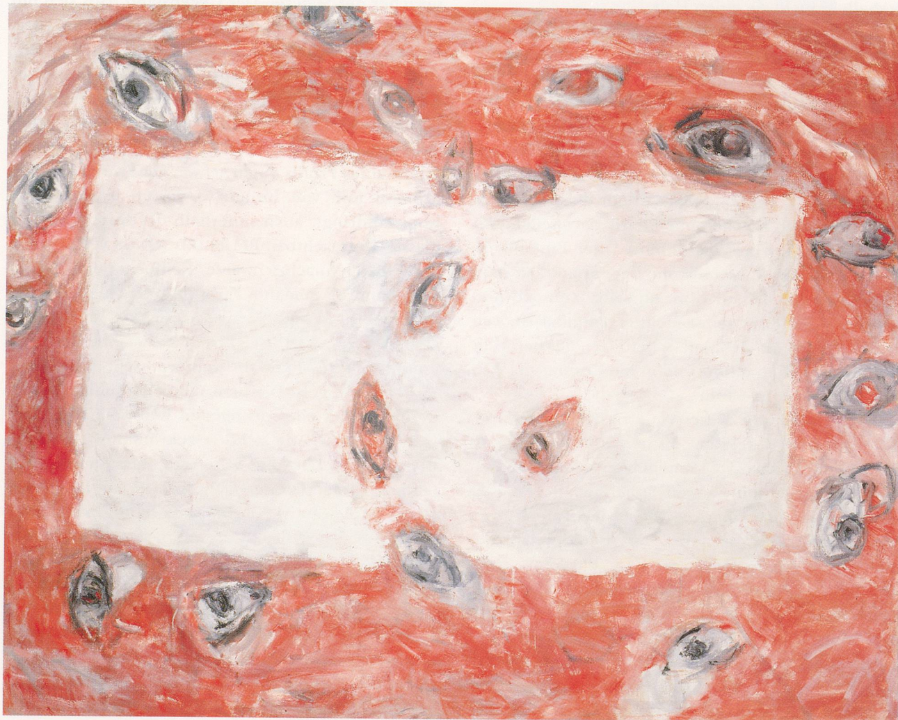
SUSAN ROTHENBERG, GHOSTRUG , 1994, oil on canvas, 54¼ x 67¼" / GEISTERTEPPICH , Öl auf Leinwand, 138 x 171 cm.