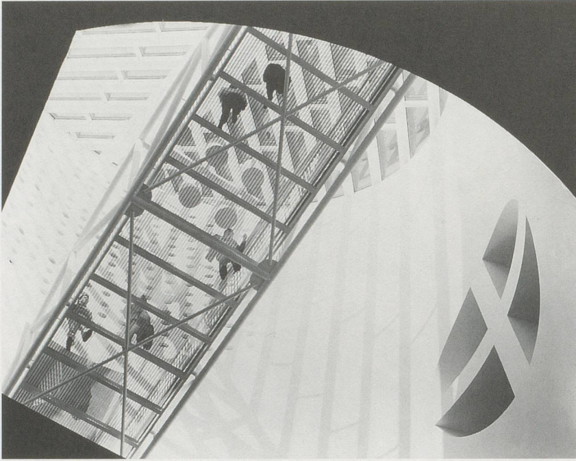
MARIO BOTTA, SAN FRANCISCO MUSEUM OF MODERN ART.