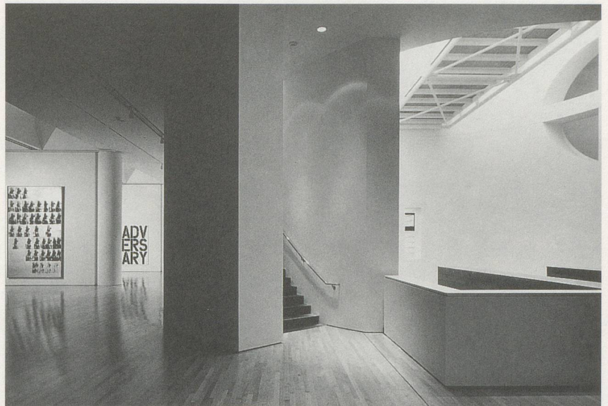
MARIO BOTTA, SAN FRANCISCO MUSEUM OF MODERN ART.

Das erklärte Ziel der Ausstellung ist die Auseinandersetzung mit «...einem der komplexesten Probleme unserer Zeit: wie photographische und technologisch produzierte Bilder die gesellschaftliche Realität vermitteln und definieren». Diesem Problem kann man natürlich nicht ausweichen, und es wirft viele Fragen auf. Interessanterweise ist aber so gut wie keiner der Künstler vertreten, die sich bei diesem Thema eigentlich aufdrängen würden (Cindy Sherman zum Beispiel). Die Ausstellung ist deshalb auch nicht einfach eine Aufbereitung von «Image