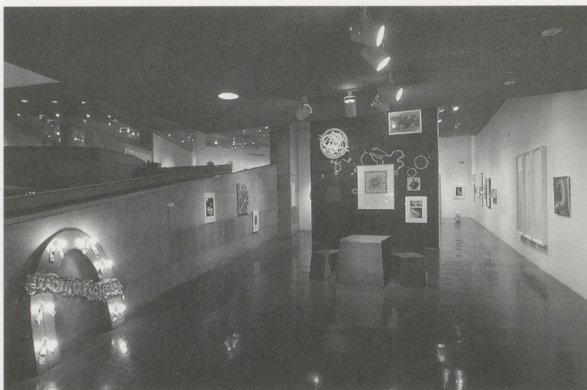
IN A DIFFERENT LIGHT / IN EINEM ANDEREN LICHT, University Art Museum, Berkeley, January 1995.

seien John Baldessaris frühe Text- und Bildgemälde; sowohl die Film- als auch eine Videoinstallationsversion von BORDERING ON FICTION: CHANTAL AKERMANS'S D'EST (An der Grenze zur Fiktion: Chantal Akermans Aus dem Osten, 1994); OPPOSING MIRRORS AND VIDEO MONITORS ON TIME DELAY (Entgegengesetzte Spiegel und Videomonitore in zeitlicher Verzögerung, 1974) von Dan Graham; eine Installation von Cady Noland sowie die bereits erwähnten Werke von Warhol und Richter. Bedauerlicherweise leidet Felix Gonzalez-Torres' Stapel-Werk darunter, dass es vom Publikum nicht – wie ursprünglich vorgesehen – berührt werden kann. Die pinwandartige Collage von Larry Clark war enttäuschend, und die Wirkung seiner Donahue-Videoinstallation 1) ging in diesem Rahmen irgendwie verloren. Aber im grossen und ganzen taten die Werke,