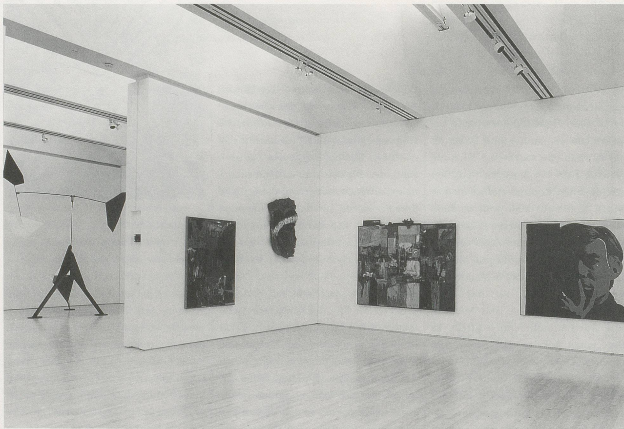
MARIO BOTTA, SAN FRANCISCO MUSEUM OF MODERN ART.

Die anregendste Ebene ist die oberste, die wechselnde Ausstellungen aus der ständigen Sammlung beherbergt. Obwohl sie stellenweise überhängt ist (ein guter Imi Knoebel ist zum Beispiel zu gross für die Ecke, in der er plaziert