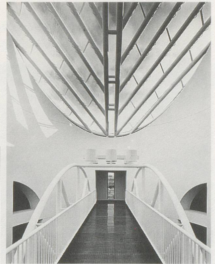
MARIO BOTTA, SAN FRANCISCO MUSEUM OF MODERN ART.

Das neue Gebäude ist ein ausdrucksvoller Bau des Schweizer Architekten Mario Botta. Es ist sein erstes Projekt in den Vereinigten Staaten und wird sicher zu einem Anziehungspunkt der Stadt werden. Dieses Museum unterscheidet sich klar von anderen neuen Museumsbauten in den Vereinigten Staaten, etwa vom Warhol Museum von