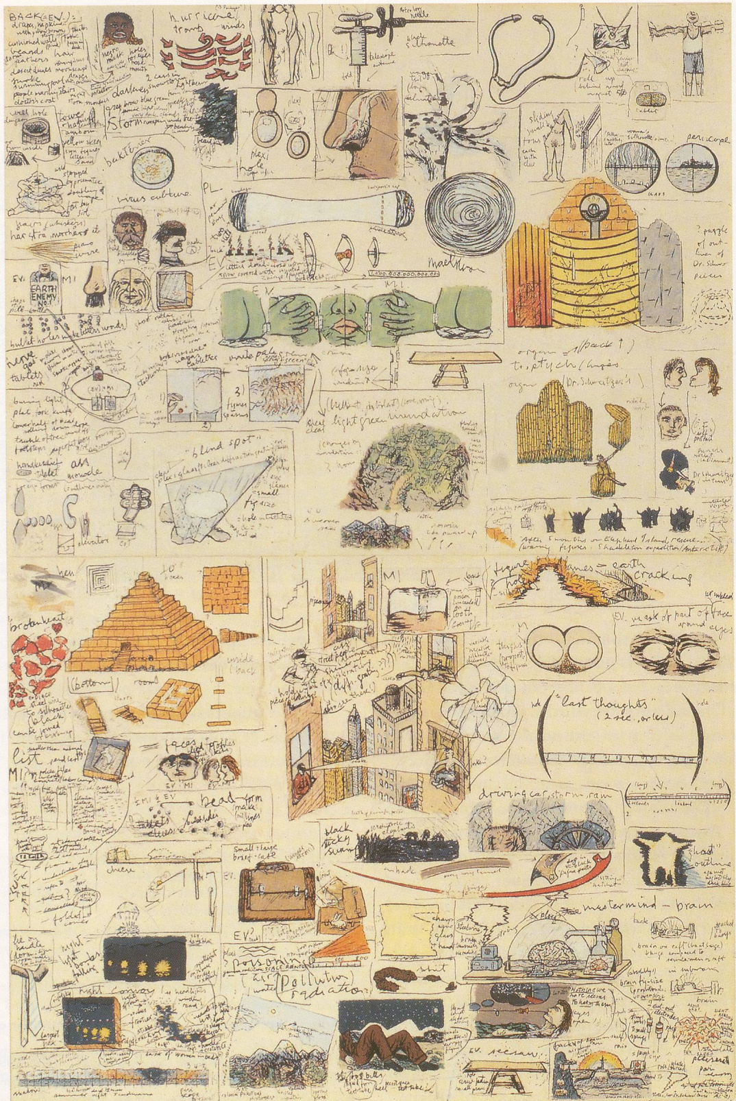
ÖYVIND FAHLSTRÖM, NOTES FOR DR. SCHWEITZER'S LAST MISSION A (1-2), 1966, tempera and ink on paper, 29 1/2 x 19 3/4" / NOTIZEN FÜR DR. SCHWEITZERS LETZTE MISSION A (1-2), Tempera und Tusche auf Papier, 75 x 50 cm.