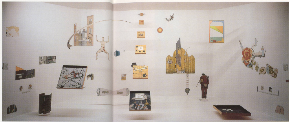
OYVIND FAHLSTRÖM: DR. SCHWEITZER'S LAST MISSION, 1962-66, tempera on 8 metal boxes, 10 cut-out boards, 30 magnetic metal and vinyl cut-outs, 177 x 402 x 89", variable / DR. SCHWEITZER'S LETZTE MISSION, Tempera auf 8 Metallkästen, 10 ausgeschnittene Tafeln, 30 magnetische Ausschneidefiguren in Metall und Vinyl, 450 x 1720 x 225 cm, variabel.

In a discussion with the critic Torsten Ekbohm, Fahlström elaborated on the political responsibilities of the contemporary artist: "The artist is like an