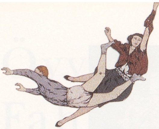
ÖYVIND FAHLSTRÖM, DR. SCHWEITZER'S LAST MISSION, 1962–66, detail / DR. SCHWEITZER'S LETZTE MISSION, Detail.

und Folgen dar.» 4) So überladen und verwirrend diese Arbeit ist, mit ihr kam Fahlström einem dauerhaft gültigen Modell wohl näher als in irgendeinem anderen Werk. Die übrigen Werke aus diesem Zeitraum betonen meist das absolut Wechselhafte der politischen Verhältnisse. Die variablen Bilder spiegeln das Bestreben, dem unentwegten Fließen Rechnung zu tragen. Sie können verändert und daher immer wieder aktualisiert werden.