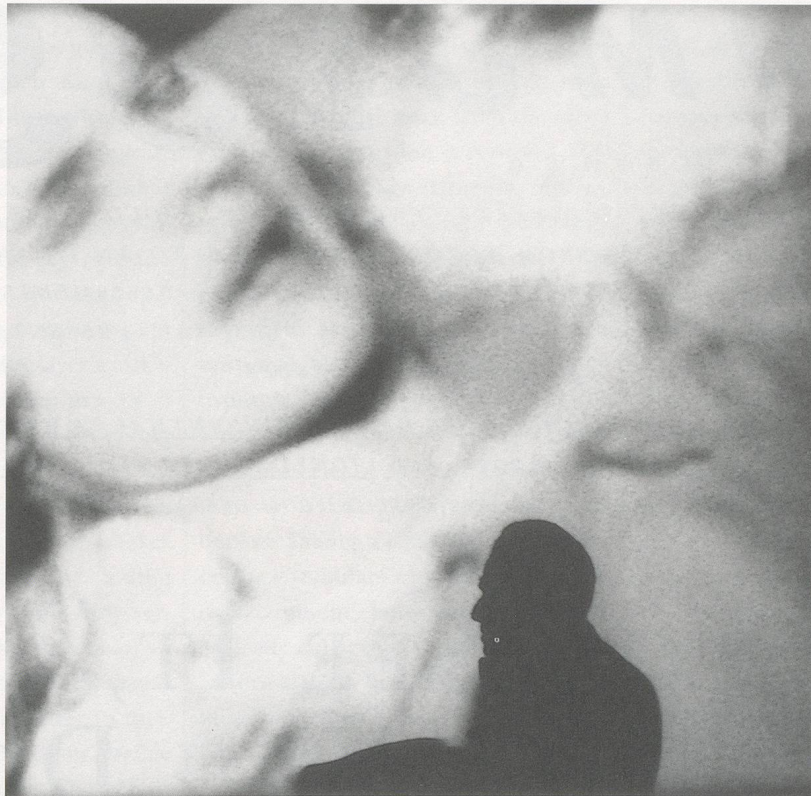
DIANE ARBUS, CARROLL BAKER ON SCREEN in "Baby Doll," 1956, gelatine-silber print, 14 x 11" / CARROLL BAKER AUF DER KINOLEINWAND, in «Baby Doll», 35,6 x 27,9 cm.

nimmt, bleibt nur eine verschwommene Landschaft. Deckt man die Figuren auf diesen Photos mit der Hand ab, so verwandeln diese sich in Bilder eines Photo-Sezessionisten: hübsche Ornamente aus verschlungenen Ästen, gesprenkeltes Licht. Arbus' Motive brauchen kein Setting; sie stechen aus dem Nebel und aus dem Dunkel hervor. Als in Stanley Kubriks Film The Shining Arbus' berühmtes Bild von den identischen Zwillingen erscheint, verlieren diese durch den Transfer nichts von ihrem sinistren Charme. Es ist das Unwiderstehliche eines kindlichen «Guckguck-wo-bin-Ich», vermischt mit dem Kitzel einer Peepshow.