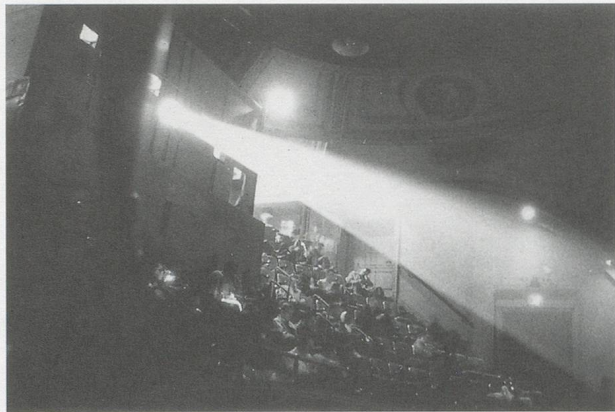
DIANE ARBUS, MOVIE THEATER LOBBY, NEW YORK CITY, 1958, gelatin-silver print, 14 x 11" / KINO-EINGANGSHALLE, 35,6 x 27,9 cm.