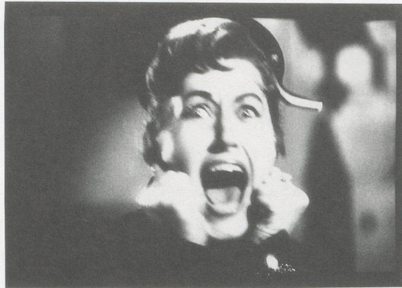
DIANE ARBUS, MURDER WITNESS, 1958, from the film / aus dem Film «New York Confidential», gelatin-silver print, 11 x 14" / 27,9 x 35,6 cm.

be broken down into three distinct classes: "born freaks, made freaks, and two-timers." Two-timers—has-been celebrities and ex-convicts—were considered the lowest echelon; born freaks like herself were the aristocrats of the sideshow world.