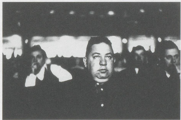
DIANE ARBUS, MOVIE THEATER USHER STANDING BY THE BOX OFFICE, NEW YORK CITY, ca. 1956, gelatine-silver print, 14 x 11" / PLATZANWEISER NEBEN DER KINOKASSE STEHEND, 35,6 x 27,9 cm.