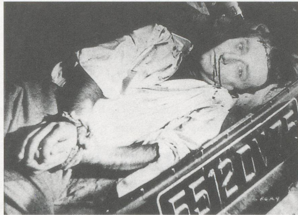
DIANE ARBUS, A CORPSE , 1958, from / aus « The Foxiest Girl in Paris », gelatin-silver print, 11 x 14" / 27,9 x 35,6 cm.

eight years. The resultant well-known image, A JEWISH GIANT AT HOME WITH HIS PARENTS IN THE BRONX (1970), echoes the tell-tale drama displayed in her earlier photographs of lurid movie posters and cinematic climaxes.