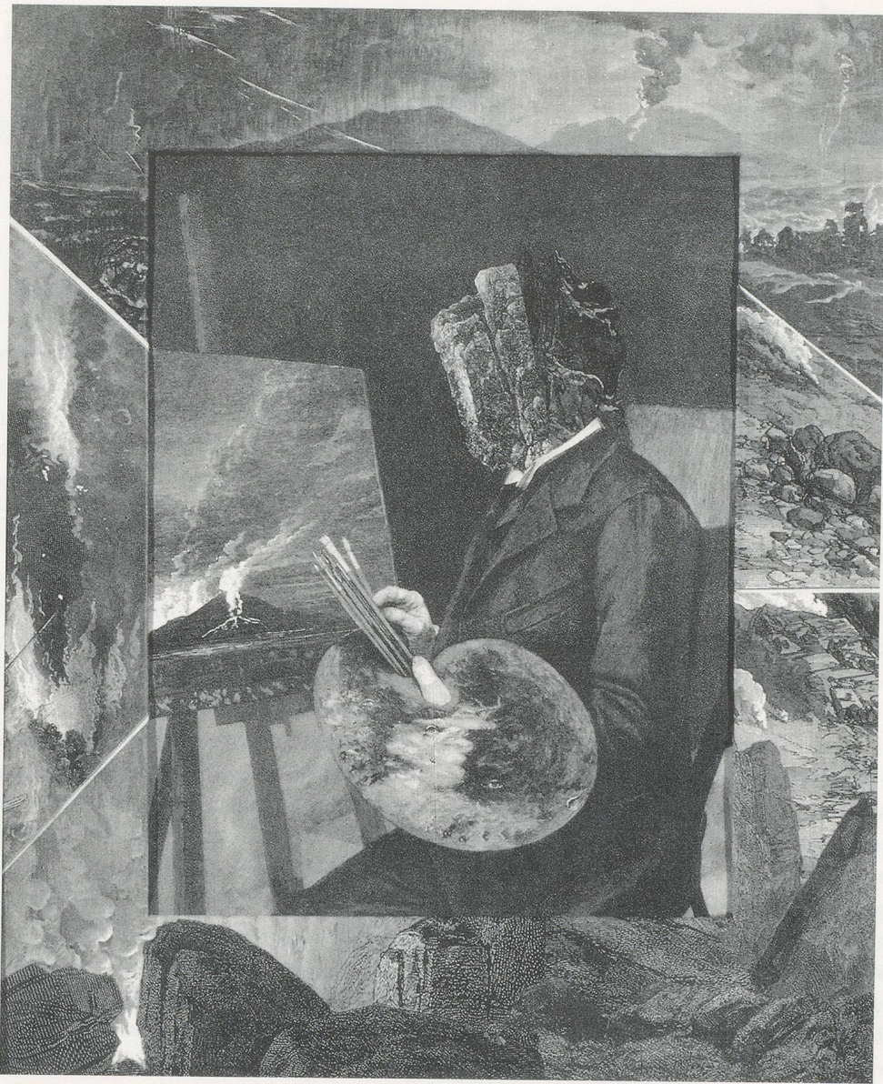
BRUCE CONNOR, PORTRAIT, 2/19/92, engraving-collage with Yes Glue 14½ x 12" /

PORTRÄT, 19.2.92, Radierungscollage mit Leim, 36,8 x 30,5 cm.