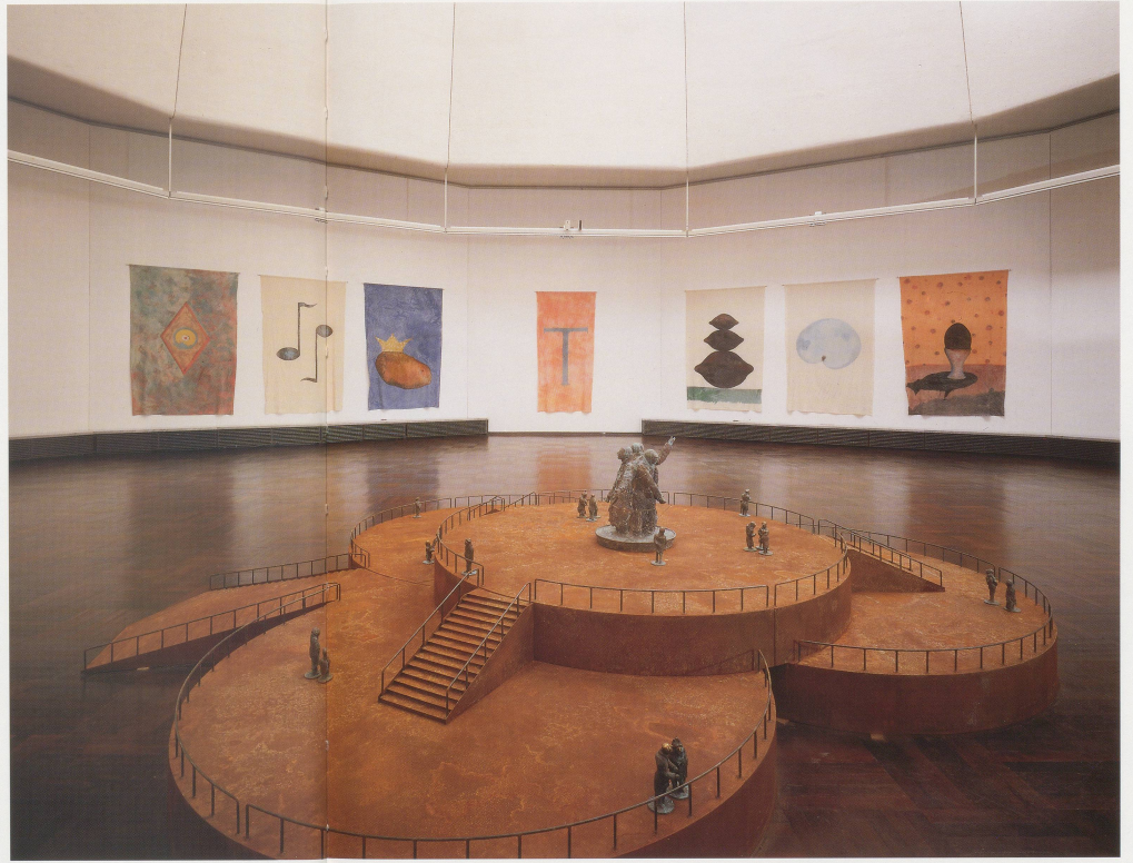
THOMAS SCHÜTTE, GROSSE RUSPEKT, 1994, Stahl und Bronze, Durchmesser 480 cm / 15' 9" diameter, DEKA FAUNEN 1989/90, StgB, Jr. 200 x 130 cm, Installation Würzburgerischer Kunsterren Städtgalerie, 1994 / doh, 6' 6", x 4' 3", *sch