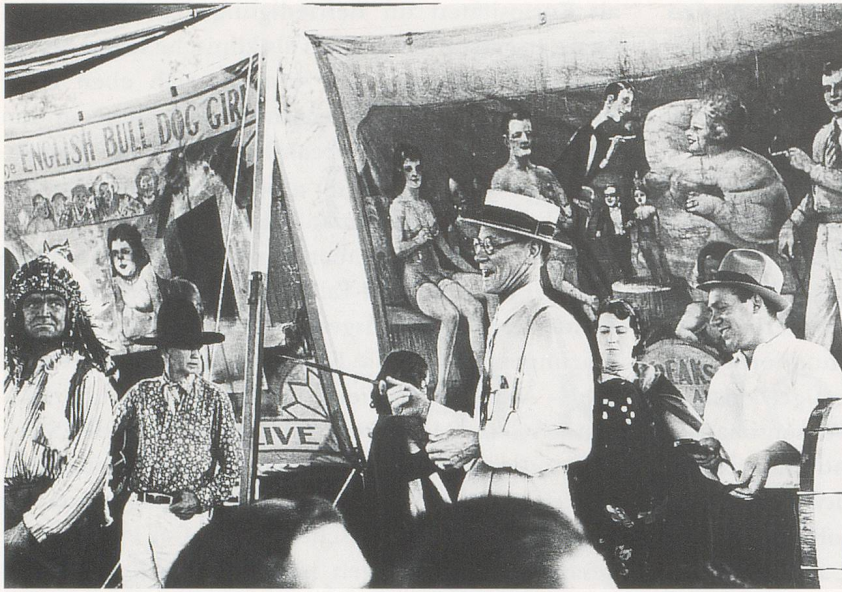
Side-show talker at Louisiana State Fair, 1938 / Ausrufer einer Jahrmarkt-Freakshow in Louisiana.