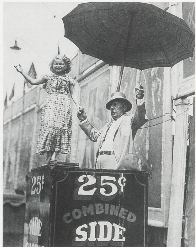
Ringling Brothers and Barnum & Bailey Side Show, ca. 1930.

Erfolg im Showbusiness zieht Imitation nach sich. Imitation ist eine Wettbewerbsstrategie. Zwar mahnen uns die Kapitalisten, Wettbewerb sei gut; doch im Falle der Freakshow und der Talkshow, die ja beide auf der Ausbeutung von Ungewöhnlichem basieren, kann Imitation das gesamte Genre aushöhlen. Wenn man zeigt, was alle anderen auch zeigen, verblasst die Attraktion. Wettbewerb kann zu Innovationen führen; aber wenn es um ein Geschäft geht, das in den Randbereichen des Anstands operiert, dann kann die Innovation leicht die Grenzen des guten Geschmacks überschreiten. Talkshows