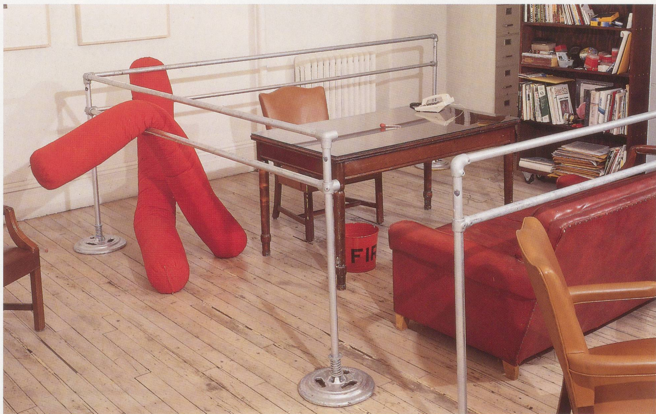
CADY NOLAND, BLANK FOR SERIAL . 1989, mixed media, installation at American Fine Arts, New York / RAUM FÜR EINE SERIE .