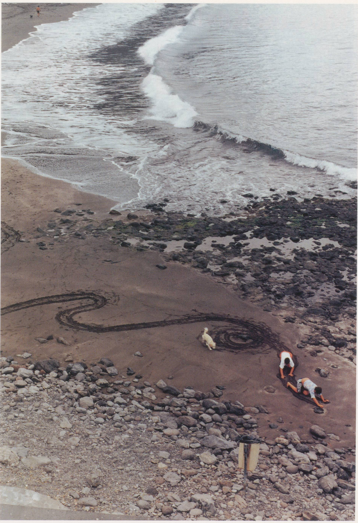
WOLFGANG TILLMANS, UNTITLED (LA GOMERA), 1997, c-print, 40 x 30 cm & 60 x 50 cm & 16 x 20" & 16 x 12"; bubble-jet print, 170 x 120 cm / 67 x 47 1/4".