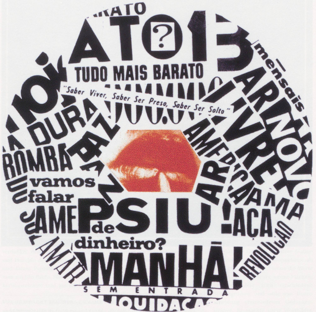
AUGUSTO DE CAMPOS, PSIU / SHHH , 1966, collage of newspaper and magazine clippings, 23 3/8" in diameter / Collage, Durchmesser 60 cm.