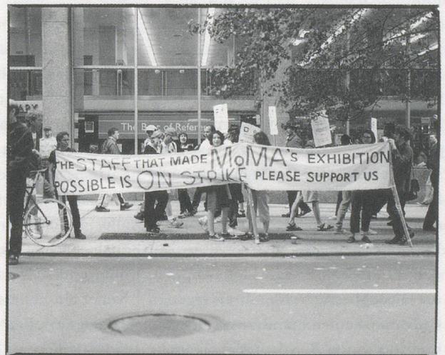
MoMA staff on strike, New York, June 2000 / Streikende Belegschaft des Museum of Modern Art in New York.