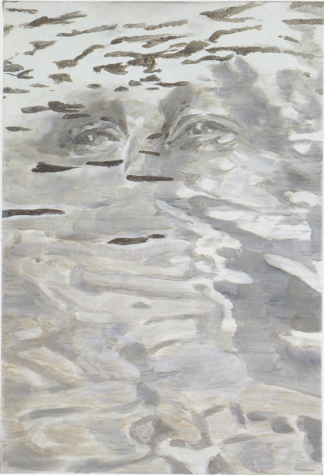
LUC TUYMANS, RESENTMENT, 1995, oil on canvas, 37 1/4 x 25" / RESENTIMENT, Öl auf Leinwand, 94,5 x 63,5 cm.