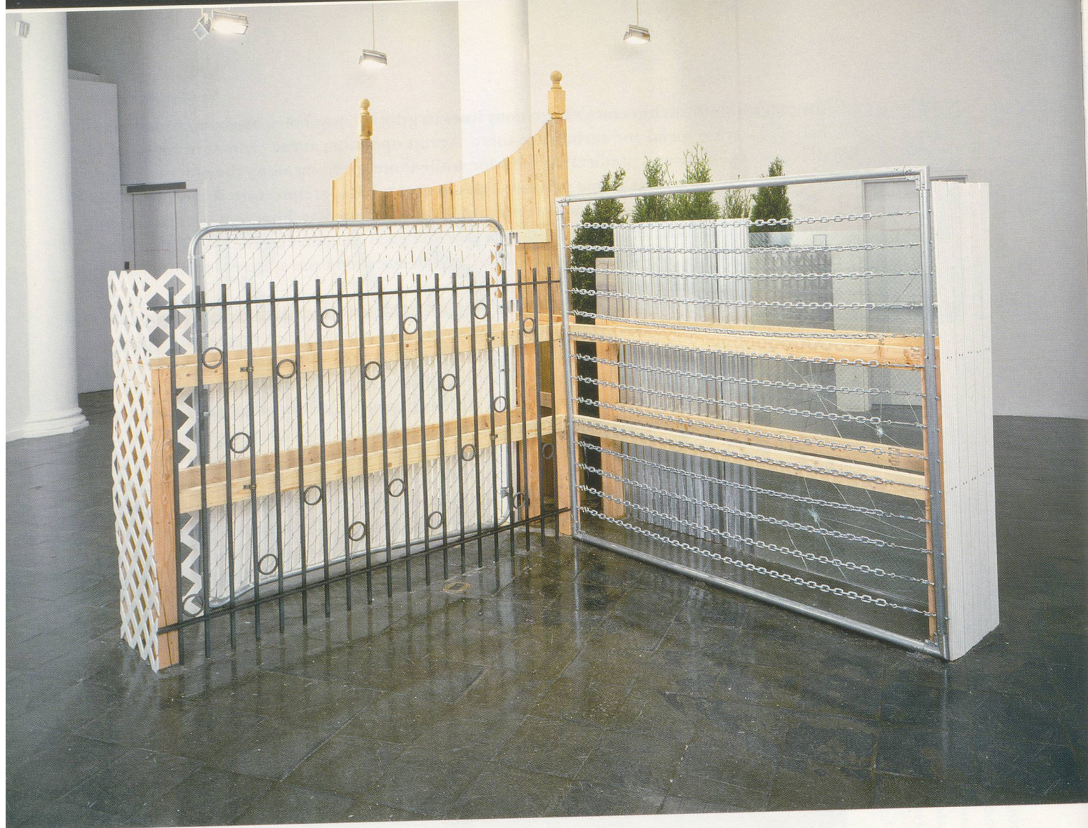
MONICA BONVICINI, TURNING WALLS , NEW YORK, 2003, wood, galvanized steel, chains, vinyl fence, concrete bricks, aluminum panel, broken safety glass, plants, installation for "Living Inside the Grid," The New Museum, New York, ca. 98½ x 275½ x 236¼" / Holz, galvanisierter Stahl, Vinylzaun, Bausteine, Aluminium, gesprungenes Sicherheitsglas, Pflanzen, ca. 250 x 700 x 600 cm.

Seeing this as a premature experience of the basic confines of architecture leads us to the more concrete examples expressed in Bonvicini's later projects. But let me first engage the hedge-crashing.