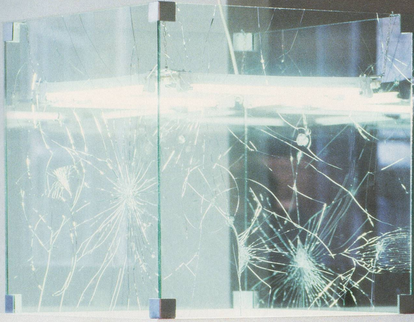
MONICA BONVICINI, WHITE, 2003, fluorescent lights, broken safety glass, aluminum corners, base. Glass cube: 26 x 26 x 26"; base: 46 1/16 x 27 1/8 x 27 1/8" / Leuchtstoffröhren, gesprungenes Sicherheitsglas, Aluminiumecken, Sockel. Glaskubus: 66 x 66 x 66 cm; Sockel: 117 x 69 x 69 cm.