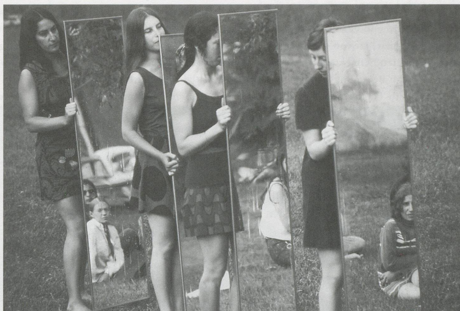
JOAN JONAS, MIRROR PIECE I, 1969, Bard College, Annandale-on-Hudson, New York.

verzahnt sie kulturelle und mythologische Epen mit privaten Begebenheiten, Videobildern und anderen Medien. Fast immer geht Jonas räumlichen und wahrnehmungsbedingten Phänomenen nach und lässt dabei Elemente aus Tanz, Zeichnung, Skulptur oder dem japanischen No- und Kabuki-Theater einfließen. Das war schon bei MIRROR PIECE (Spiegelstück, 1967) der Fall.