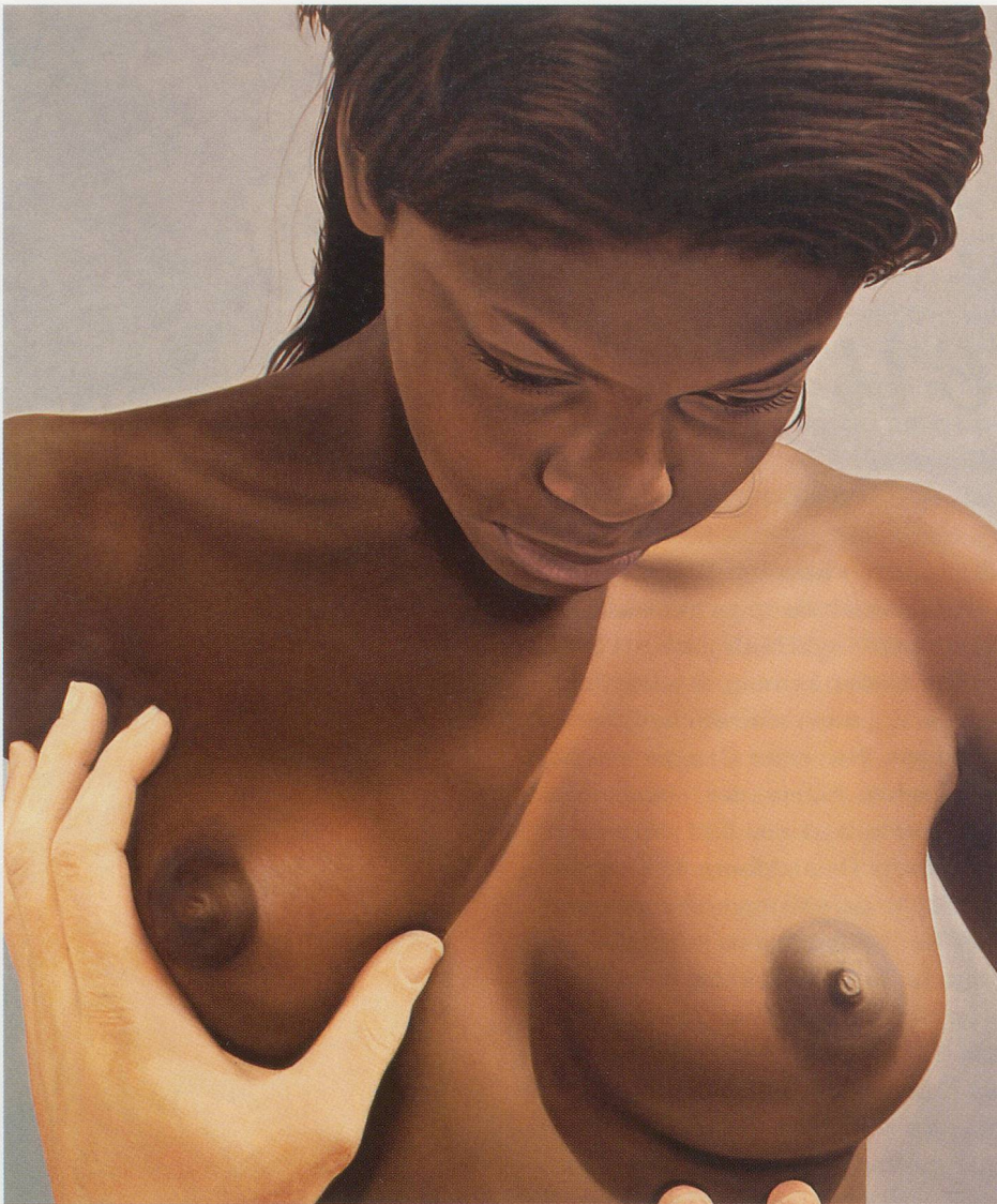
RICHARD PHILLIPS, BLESSED MOTHER , 2000, oil on linen, 84 x 72" / GESEGNETE MUTTER , Öl auf Leinen, 213,4 x 182,9 cm.

einer projizierten Dollarnote überlagerten, nackten Frau, dem eine Ausgabe des Playboy aus den 60er Jahren zugrunde liegt ( $ , 2003); schliesslich die Nahaufnahme des Kopfes einer knienden Frau, deren Haar mit Sperma bekleckert ist ( BUKKAKE , 2004). Wie kann man diese Bilder zusammenbringen, und wie lässt sich Phillips' Konzept der thematischen Gemeinsamkeit dieser Bilder erklären? Wie reagieren wir auf die breiter gestreuten Bildquellen, die sich