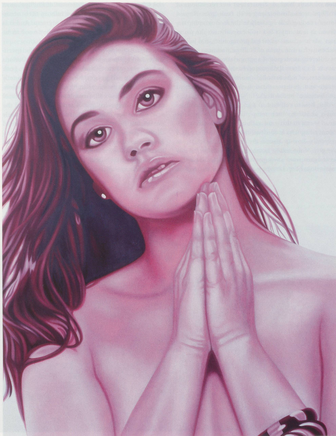
RICHARD PHILLIPS, DEMI, 2003, oil on linen, 107 x 84" / Öl auf Leinen, 271,8 x 213,4 cm.