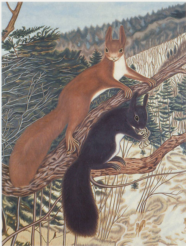
RICHARD PHILLIPS, SIMILAR TO SQUIRRELS AFTER A. DIETRICH , 2003, oil on linen, 102 1/2 x 78"/ EICHHÖRNCHEN NACH A. DIETRICH , Öl auf Leinen, 260,4 x 198,1 cm.

Goldstein's pictures are radical—in their ambivalence and discursivity, their obstinate refusal to specify meaning, allowing it to hover dangerously at peripheries, opening a fissure in our expectations of representation. 4