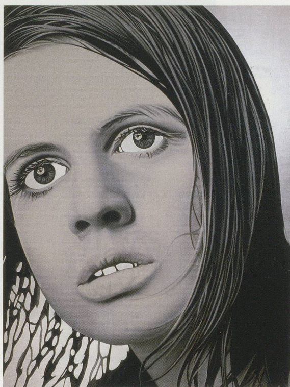
RICHARD PHILLIPS, VENETIA CUNNINGHAM (LEFT) (AFTER JOHN D GREEN), 2002, oil and aluminum leaf on linen, 84 x 64 1/2" / Öl und Blattaluminium auf Leinen, 213,6 x 163,8 cm.

Für eine Ausstellung im Consortium Dijon brachte Richard Phillips erstmals eine Gruppe von sechs Bildern zusammen, die ursprünglich als eine Art Serie konzipiert waren. Die Bilder können in zwei Gruppen unterteilt werden, die unterschiedlichen thematischen Strängen folgen. Die erste Gruppe enthält ein Porträt des indischen Gurus der alternativen Medizin, Deepak Chopra, und ein Bild der amerikanischen Schauspielerin Demi Moore in Betpose. DEEPAK CHOPRA (2003) ist ein ungefähr zwei mal acht Meter grosses Bild und zeigt in warmen Rot-, Orange- und Brauntönen ein offizielles Werbeporträt Chopras, das in dichter Staffelung, leicht überlappend, siebenmal nebeneinander gelegt ist. Das etwa zwei mal drei Meter grosse Bild DEMI MOORE (2003) ist ausschliesslich in blass rotvioletten Farbtönen gemalt und basiert auf einem Standphoto eines frühen Films von Demi Moore. Die zweite Gruppe bringt noch viel disparatere Motive zusammen, dazu gehört auch ein Porträt des deutschen Aussenministers Joschka Fischer, dem ein aktuelles Wahlkampfplakat zugrunde liegt und das mit dem Logo der Luxusmarke Montblanc ergänzt wurde (THE SPOKESPERSON / Der Wortführer, 2004); die Kopie eines Gemäldes des Thurgauer Aussenseiterkünstlers Adolf Dietrich (1877–1957), welche zwei Eichhörnchen zeigt (SIMILAR TO SQUIRRELS AFTER A. DIETRICH, 2004); ein Bild einer vom Schatten