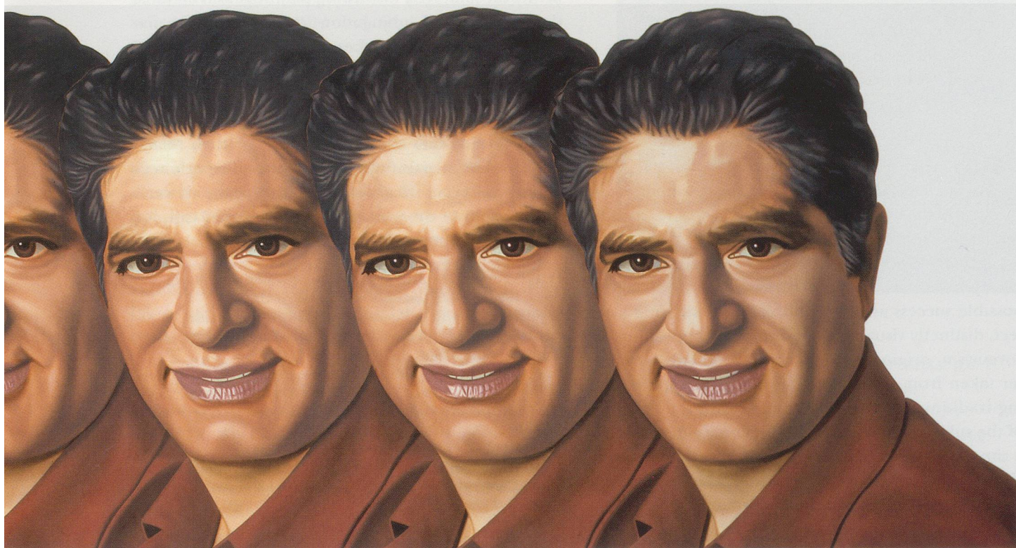
RICHARD PHILLIPS, DEEPAK, 2003, oil on linen, 84 x 314" / Öl auf Leinen, 213,4 x 797,6 cm.

Maintaining the work in the field of literality rather than abstraction involves considerable risk; there is a fine line between the image's success as revelation and its failure, its becoming a kind of pornography—a voyeuristic spectacle—or just banal sci-fi fantasy. But it is precisely here that