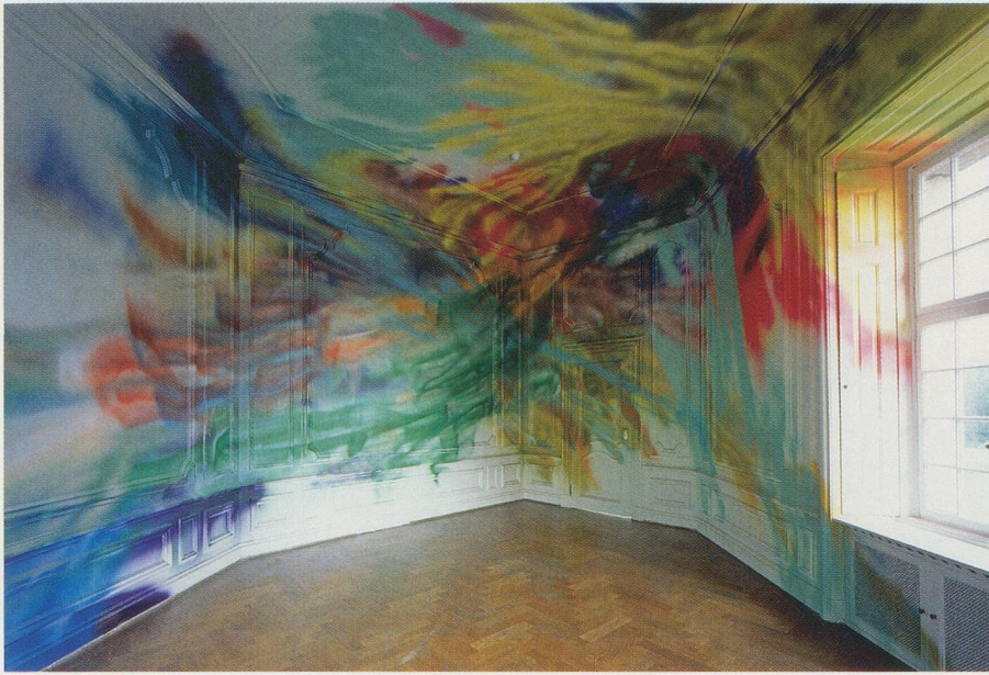
KATHARINA GROSSE, UNTITLED, 2003, acrylic on wall, "Grazie" Schloss Dyck, Jüchen, 168 1/2 x 732 5/8" / Acryl auf Wand, 428 x 1861 cm.

mälde sind alles andere als statisch, sondern wirken vielmehr wie ständig im Fluss. Es gibt immer wieder Neues zu entdecken, neue Betrachtungswinkel, und es ist wichtig, sich bei der Besichtigung der Arbeiten von Katharina Grosse Zeit zu lassen: Es kann passieren, dass ein und dieselbe Arbeit beim zweiten oder dritten Mal völlig anders wirkt. Hinzu kommt, dass Grosses Arbeiten, da sie häufig Wände und Decken in ungewohnten Winkeln miteinander verbinden und über angrenzende Wände weiterlaufen, eine überwältigende, ja manchmal geradezu Schwindel erregende Raumwirkung erzeugen. Beim Betrachten eines ihrer abstrakten Gemälde ist man gleichzeitig umfassen von den Farbkaskaden und ständig wechselnden Formen, die im Begriff scheinen, ganz von den Wänden herabzustürzen.