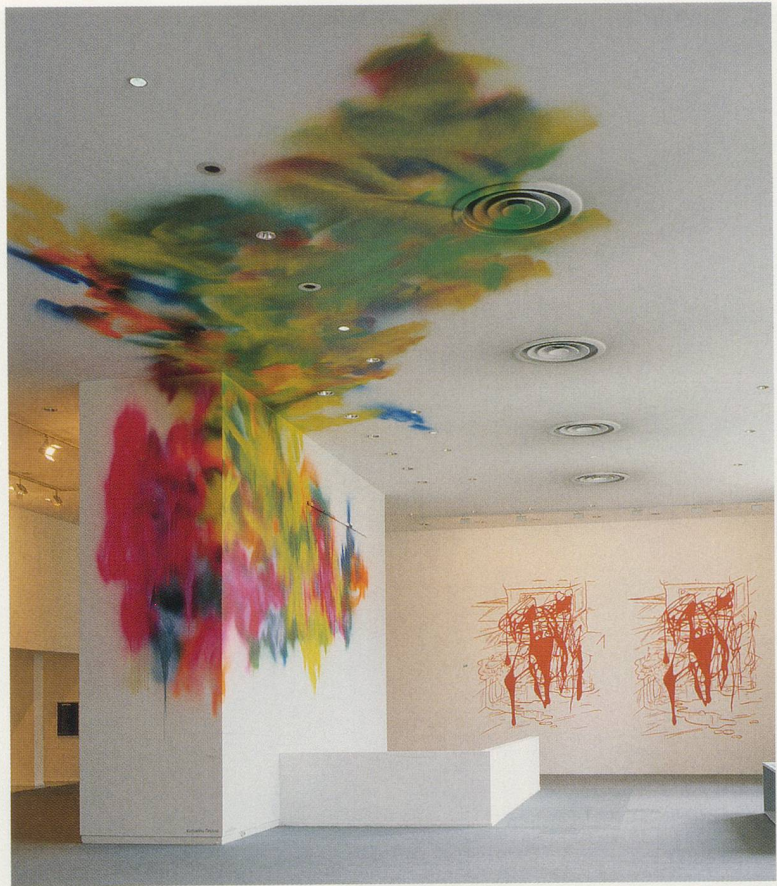
KATHARINA GROSSE, UNTITLED, 2002, acrylic on wall and ceiling, "Urgent Painting," Musée d'Art Moderne de la Ville de Paris, 214 1/2 x 630 x 74" / Acryl auf Wand und Decke, 545 x 1600 x 188 cm.

Page / Seite 108 / 109: KATHARINA GROSSE, UNTITLED, 2004, acrylic on concrete floor, clothes, books, and eggs, "Perspectives 143: Katharina Grosse," Contemporary Arts Museum Houston, Texas, 119 7/8 x 707 7/8 x 839 3/4" / Acryl auf Betonboden, Kleidung, Bücher, Eier, 304 x 1798 x 2133 cm.