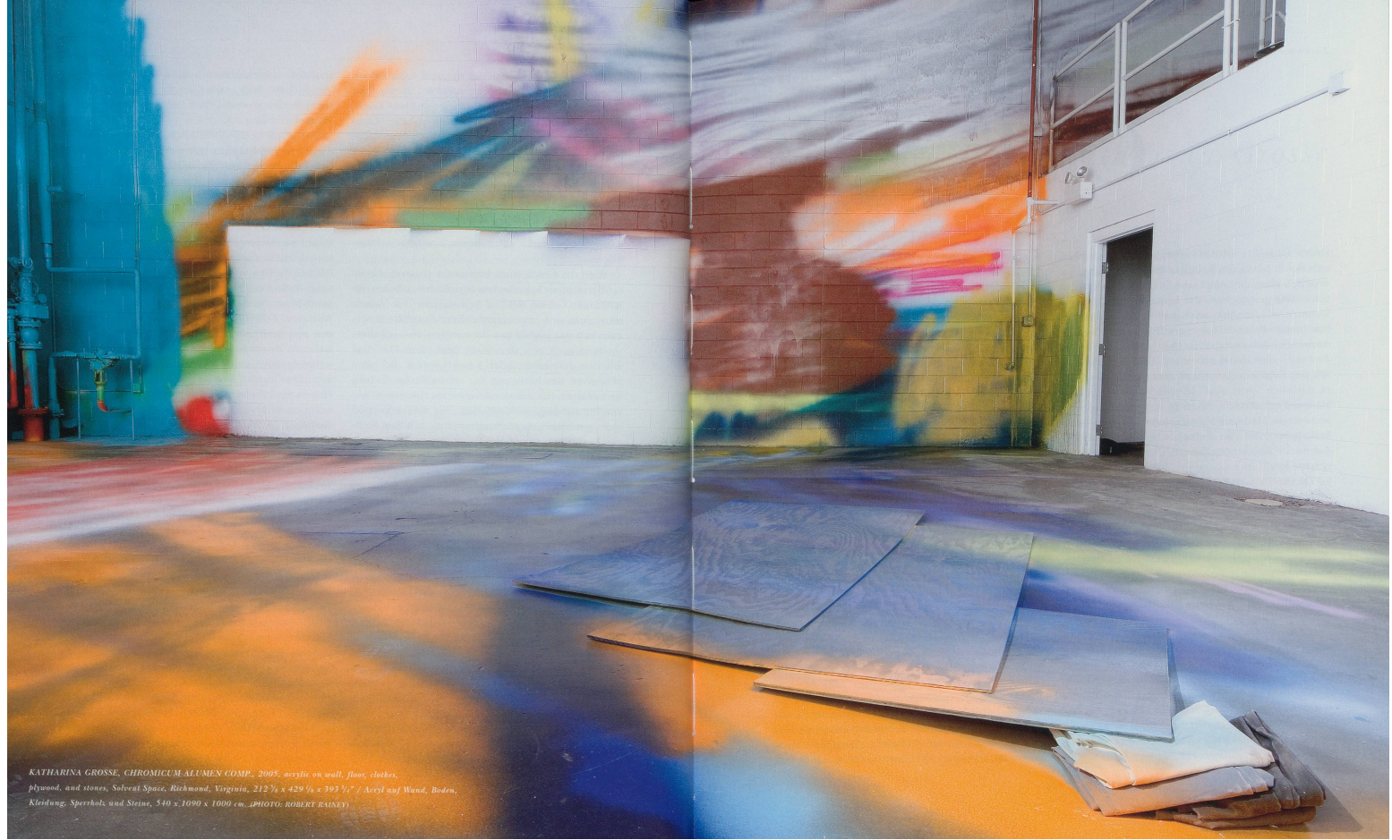
KATHARINA GROSSE, CHROMICUM ALUMEN COMP., 2005, acrylic on wall, floor, clothes, plywood, and stones, Solvent Space, Richmond, Virginia, 212 7/8 x 429 1/8 x 393 1/2" / Acryl auf Wand, Boden, Kleidung, Sperrholz, und Steine, 540 x 1090 x 1000 cm.