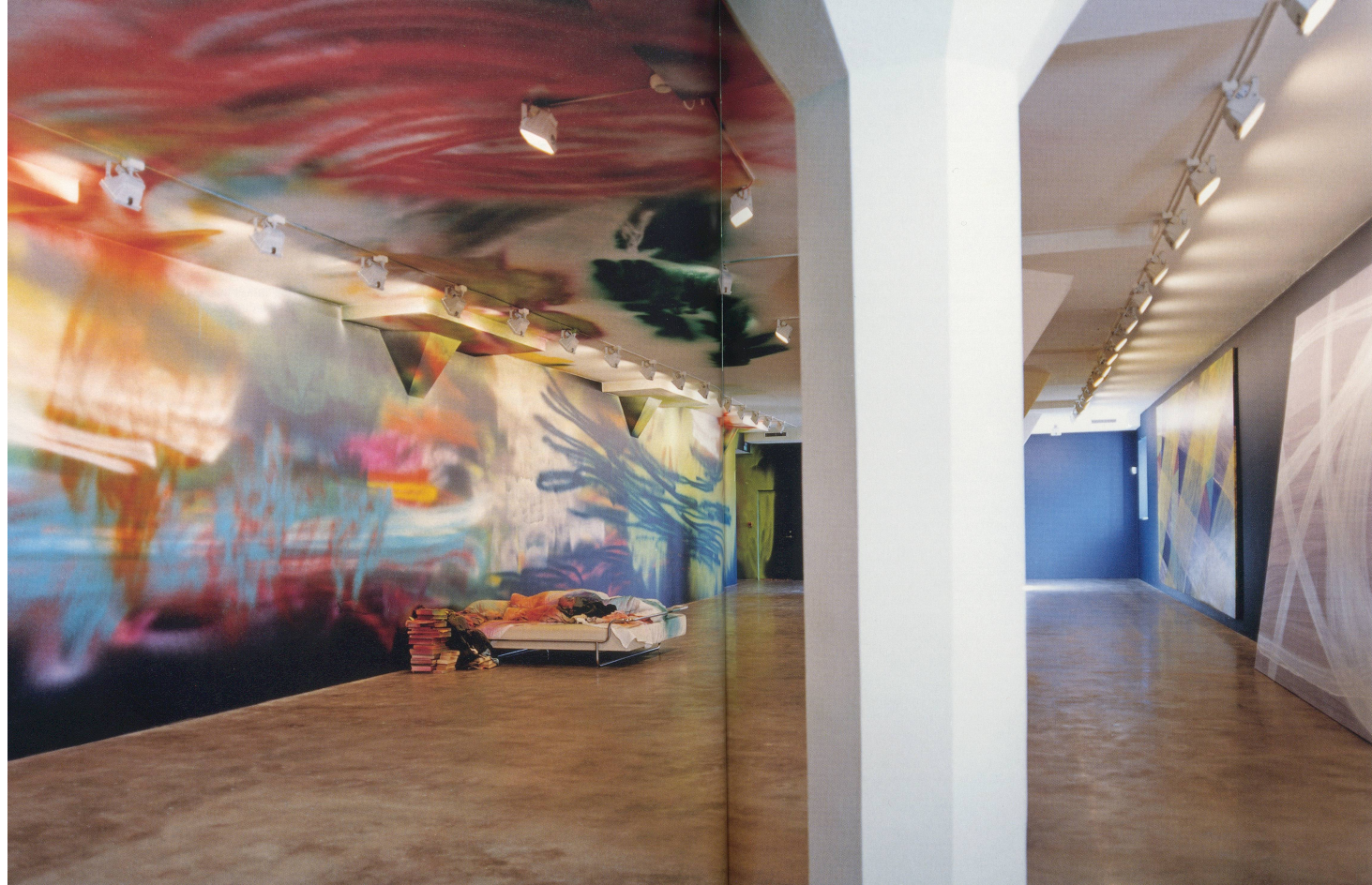
KATHARINA GROSSKOPF, INFINITE LOGIC CONFERENCE, 2004, acrylic on wall, floor, bed, bedcover, books, and clothes, Museum 3 Stockholm Konsthall, Stockholm, 152 1/2 x 944 1/2 x 322 1/2" / Acryl auf Wand, Boden, Bett, Decke, Bücher und Kleidung, 388 x 2360 x 820 cm.