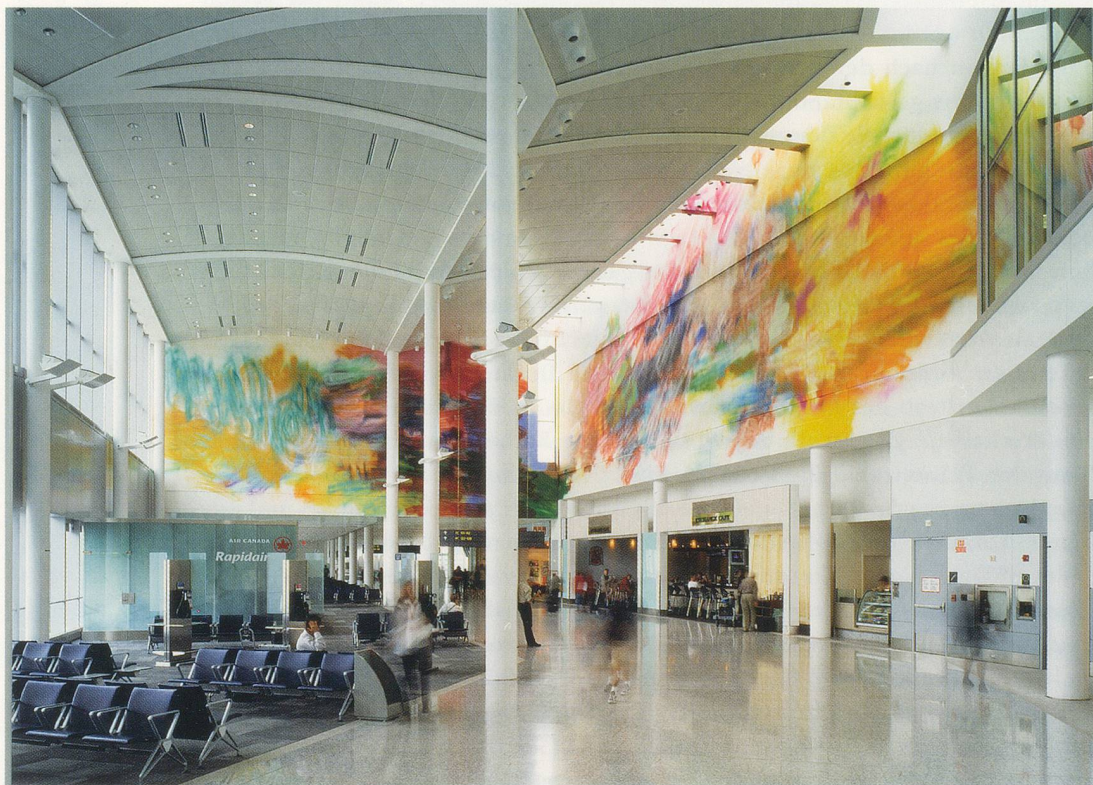
KATHARINA GROSSE, UNTITLED , 2003, acrylic on wall, Pearson International Airport, Toronto, 348 7/16 x 689 x 925 2/8" / Acryl auf Wand, 885 x 1750 x 2350 cm.