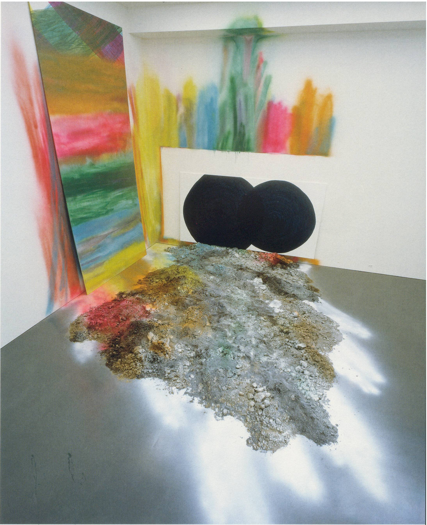
KATHARINA GROSSE, THE POISE OF THE HEAD UND DIE ANDEREN FOLGEN, 2004, acrylic on wall, floor, soil, and 2 canvases, "raumfürraum" Kunsthalle Düsseldorf, Kunstverein für die Rheinlande und Westfalen, 354 x 354 x 433" / Acryl auf Wand, Boden, Erde und 2 Leinwände, 900 x 900 x 1100 cm.