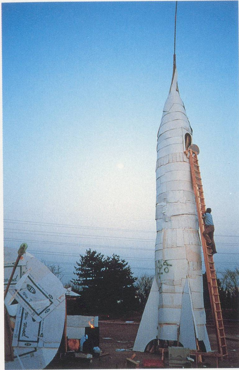
GELITIN, TRUE LOVE IV , 2002, installation view/ WAHRE LIEBE IV, Installationsansicht, Gwangju Biennale, South Korea.

neous elegance. Collaged trash looks more like translucent poesy. Their frivolous demeanor harbors within it un-courtly gallantry.