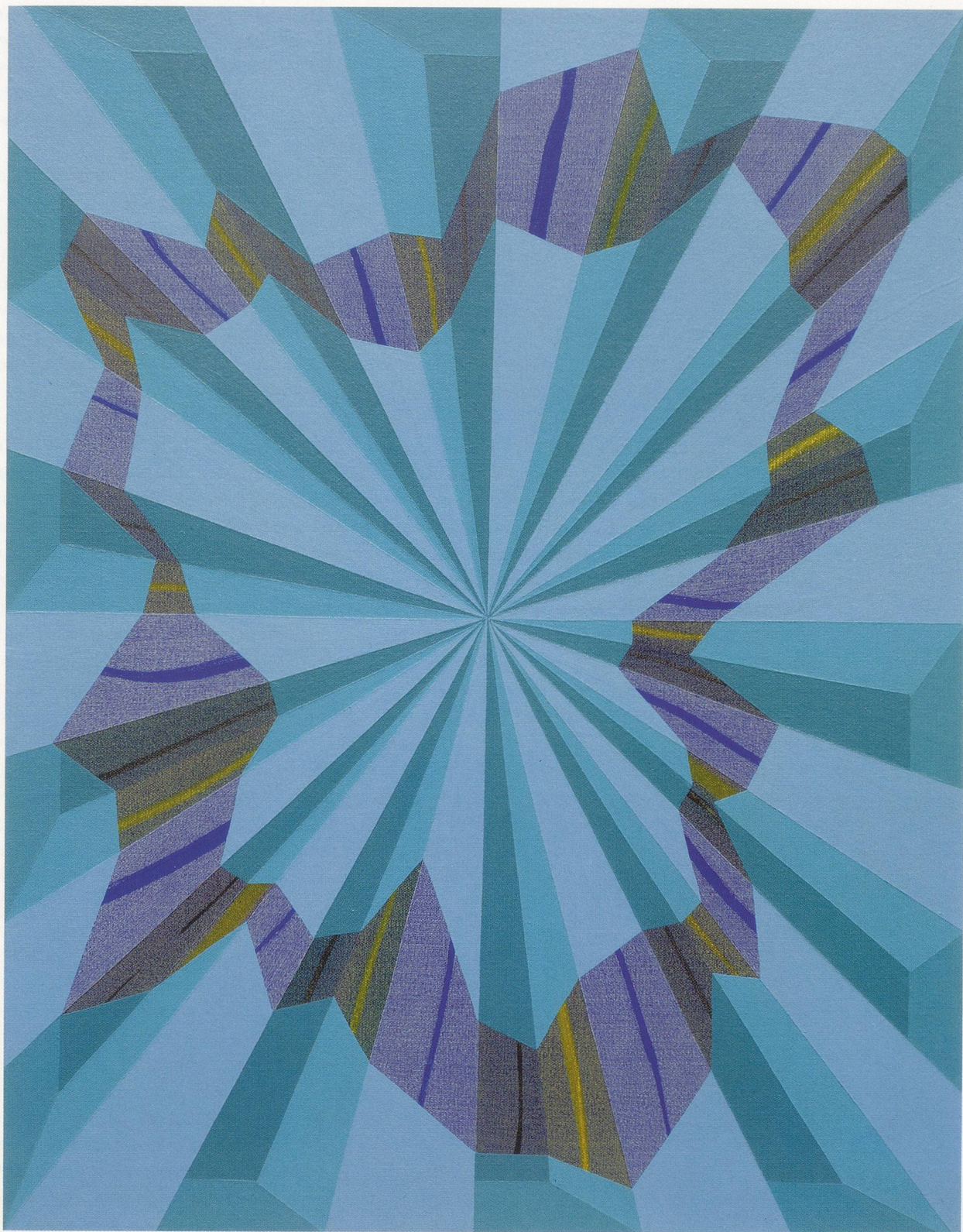
TOMMA ABTS, TEDO, 2002, acrylic and oil on canvas, 18 7/8 x 15" / Acryl und Öl auf Leinwand, 48 x 38 cm.