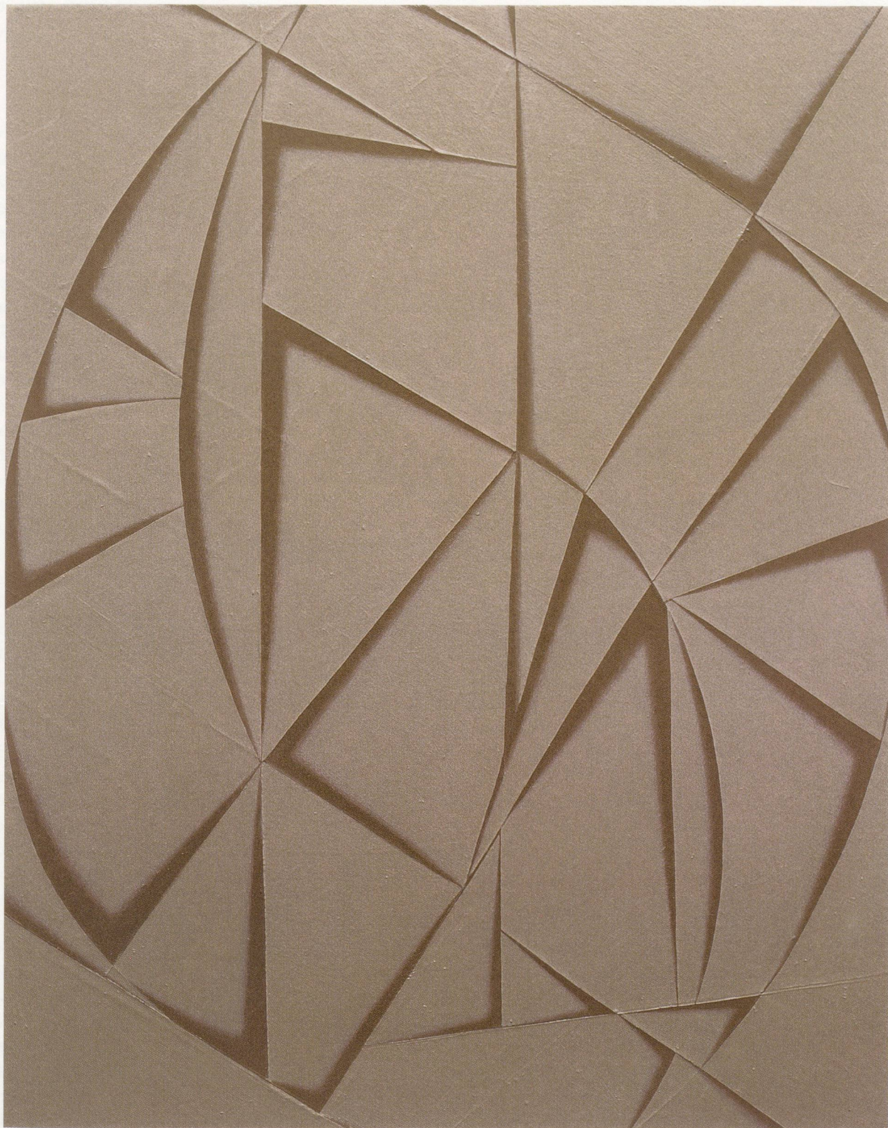
TOMMA ABTS, EPKO, 2001, acrylic and oil on canvas, 18 7/8 x 15" / Acryl und Öl auf Leinwand, 48 x 38 cm.