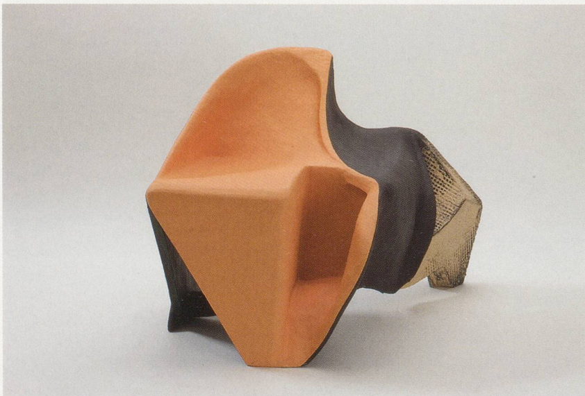
VINCENT FECTEAU, UNTITLED, 2008, papier-mâché, acrylic, 20 1/4 x 22 x 21 1/2" / Papiermaché, Acryl, 51,4 x 55,9 x 54,6 cm.

TA: I have always been painting, but as a student I also made some 16mm films that I would roughly describe as structuralist. I hardly ever filmed anything out there in the world, they were just filmed stripes for example, moving along or going in and out of focus, or hundreds of meters of lines in different rhythms and speeds scratched into the material. I guess the overlap is that I don't choose a subject or bring anything from the outside into the work directly, and that I work with the qualities of the material itself. I am not interested in translating something onto the canvas. It is all about starting with nothing as a given—maybe choosing a color, making a shape—and going from there. I want to make it all up myself from scratch. Being intensely involved in the process of constructing seems to be something we have in common.