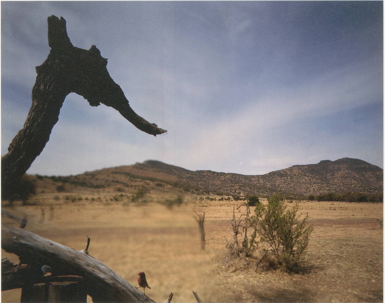
JEAN-LUC MYLAYNE, NO. 366, FÉVRIER MARS 2006, 123 x 153 cm / 48 1/2 x 60 1/4".

lung des der Kamera inhärenten Bildausschnitts mittels Öffnungen, Winkeln und Durchblicken zwischen Latten oder Lamellen hindurch, wie man sie auf Bauernhöfen findet. Bei NO. 4 rahmt eine grob geschnittene Fensteröffnung in einer Scheunenwand den taumelnden Flug einer Schwalbe ein, während im Hintergrund leeres Gelände, gewisste Mauern und schräge rote Ziegeldächer ins Blickfeld rücken. Das Bild NO. 5, JUIN JUILLET AOÛT 1979, wiederum verlegt den ländlichen Durchblick in den linken unteren Bildbereich, da der Vogel unmittelbar vor dem Aufleuchten des Kamerablitzlichtes ins Dachgesims