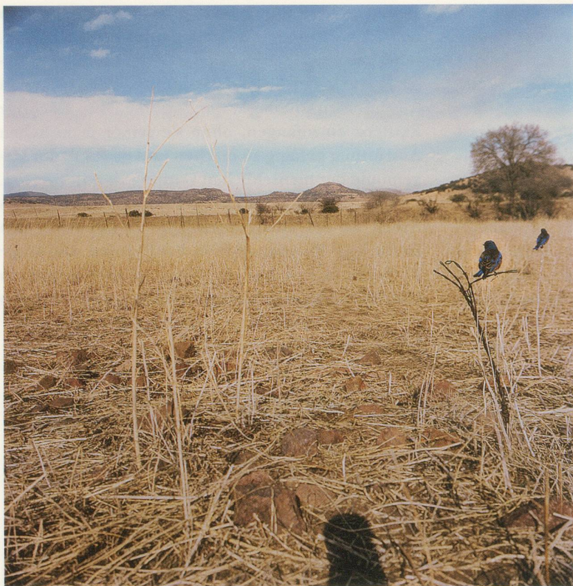
JEAN-LUC MYLAYNE, NO. 441, JANVIER FÉVRIER MARS 2007, 123 x 123 cm / 48 1/2 x 48 1/2".

Aufnahme. Mylaynes Bilder üben auf den Betrachter eine verlangsamende Wirkung aus, ein Eindruck, der durch die Tatsache verstärkt wird, dass die Titel, obwohl sie weder Vogelart noch Ort preisgeben, genaue Informationen über die Herstellungszeit jeder Photographie enthalten. Dieses Detail verrät uns, dass wir nicht mit einem «entscheidenden Moment» konfrontiert sind, sondern dass der Künstler eine vergleichsweise endlos lange Zeitspanne für die Realisierung seiner Bilder investierte. Indem er sich unsichtbar macht und darauf beschränkt, zu warten, bis der Vogel bereit ist, im zum Voraus geplanten Rahmen des «Tableaus» (wie Mylayne seine Photographien nennt) zu agieren, erteilt er der autoritativen Rolle des Künstlers eine Absage und distanziert sich vom unkritischen Glauben an die zentrale Rolle des menschlichen Subjekts.