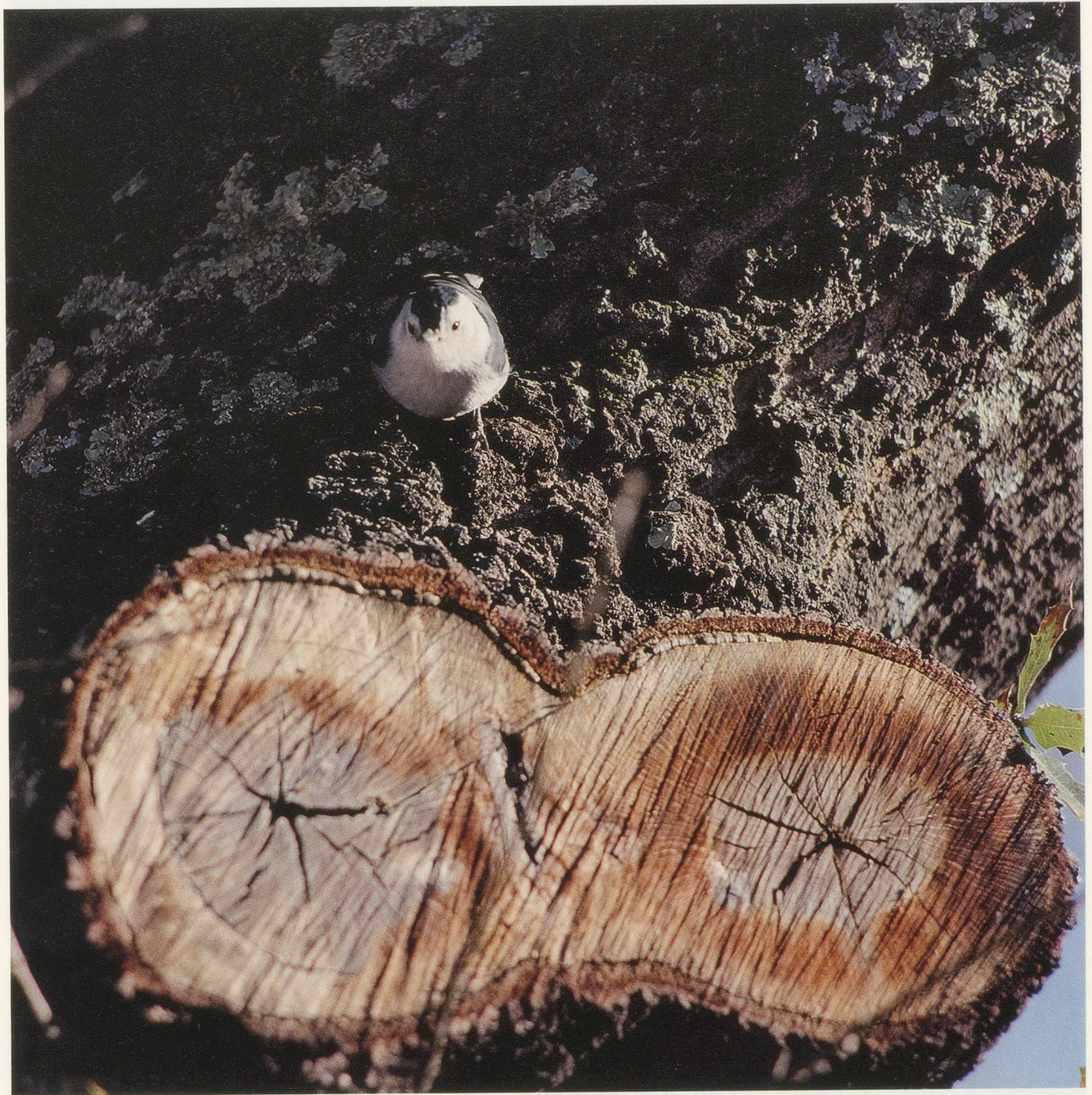
JEAN-LUC MYLAYNE, NO. 445, NOVEMBRE DÉCEMBRE 2007, 123 x 123 cm / 48 1/2 x 48 1/2".