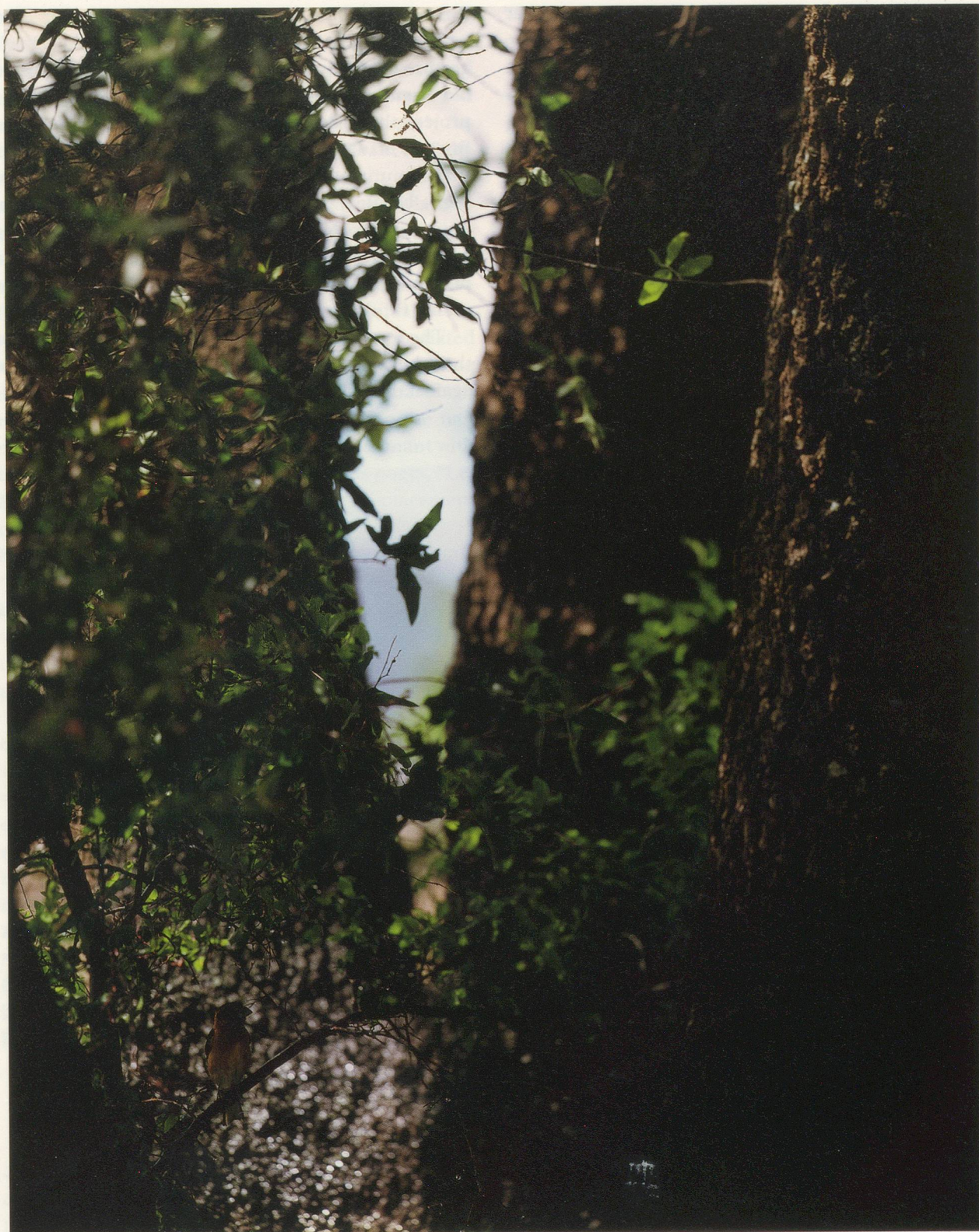
JEAN-LUC MYLAYNE, NO. 381, AVRIL MAI 2006, 228 x 183 cm / 89 3/4 x 72".