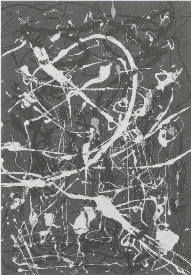
JACKSON POLLOCK, COMPOSITION NO. 16, 1948, oil on canvas on wood, 22 1/4 x 15 1/2" / KOMPOSITION NR. 16, Öl auf Leinwand und Holz, 56,5 x 39,4 cm.

kann» – und fährt fort: «Ich spreche, was mich betrifft, den Werten der Wildheit eine hohe Wertschätzung zu: Instinkt, Leidenschaft, Laune, Wucht, Wahn. Aber ich glaube nicht, dass diese Werte dem Westen abhanden gekommen sind. Ganz im Gegenteil! Die von unserer Kultur gepriesenen Werte scheinen mir nicht den wahren Bewegungen unseres Denkens zu entsprechen.» (1951) 8)