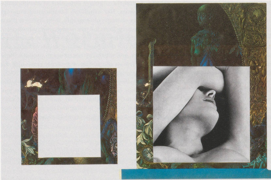
CAROL BOVE, MIRROR OF VENUS , 2007, collage, 12 x 16" / SPIEGEL DER VENUS , Collage, 30,5 x 40,6 cm.

McClure is a sixties icon of sorts, but one with a lot of Beat—that is to say, a lot of forties and fifties—in him: in 1955 he read at the legendary Gallery Six poetry evening in San Francisco, where the Beats cohered. (The druggy freedoms of the sixties were rehearsed a decade or so earlier by this group, who perpetuated themselves into the later period: not least via Jack Kerouac's muse Neal Cassady serving as the bus driver for Ken Kesey's LSD pioneers, The Merry Pranksters.) McClure advises the reader that the purpose of the joyously onomatopoeic, almost pre-linguistic poems in Ghost Tantras is "to bring beauty and change the shape of the universe," but then notes his inspirations as including William Blake and "the visionary Surrealists." 22 The throwback Cubist sculpture, meanwhile, is equally atemporal and slippery: here, the sixties are interpenetrated by the 1910s, just as McClure's professed lineage interweaves them with the Romantic era and the Surrealist thirties; in each case, it is the acts of older practitioners continuing to operate in the sixties that allow that moment to open onto earlier ones.