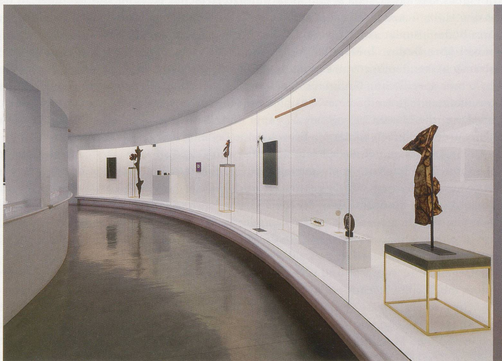
CAROL BOVE, Tate St. Ives, Cornwall, 2009 , exhibition view / Ausstellungsansicht.

Bove scheint von der Idee des Surrealismus und seinen Innovationen fasziniert zu sein, besonders wenn er als eine Art unterschwelliger Impuls auftritt – wie in den 60er-Jahren und ganz allgemein im letzten Jahrhundert. «SETTING» FOR A. POMODORO («Szenischer Rahmen» für A. Pomodoro, 2005–2007) – ein typisches Beispiel für die jüngst entstandenen, umfassenderen Objektarrangements am Boden oder auf einer Bühne – ist eine ausladende Komposition aus Bahnschwellen, spindeldürrem Treibholz, massigen Betonklötzen, der Miniaturversion einer Kugelskulptur von Arnaldo Pomodoro und – in einer späteren Version