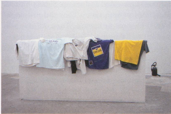
PHILIPPE PARRENO, SNOW DANCING, 1995, installation view, Le Consortium, Dijon / SCHNEETANZ, Installationsansicht.