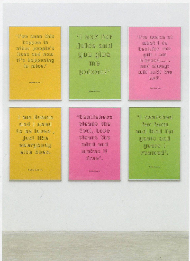
JEREMY DELLER, "Quotations," 1995, photocopies on paper / "Zitate", Photokopien auf Papier.

Deller's numerous projects relating to his pop-music heroes can at times seem very different from his works that engage collective folk practice. But the artist's underlying argument seems to be that youth culture has provided an urban and suburban middle class a way into the kind of collective, frankly or tacitly politicized, rituals that were formerly the preserve of agrarian and later industrial communities. Music has been one obvious way into this perplex of the everyday and the extraordinary. Take Deller's series of posters "QUOTATIONS" (2005), in which excerpts