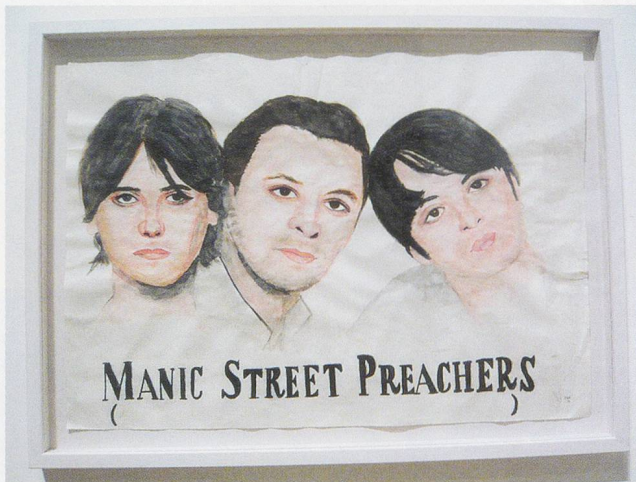
JEREMY DELLER, THE USES OF LITERACY , 1997, mixed-media installation, "Lovecraft," 1998, South London Gallery / DER NUTZEN DES ALPHABETISMUS , Installation, verschiedene Materialien.