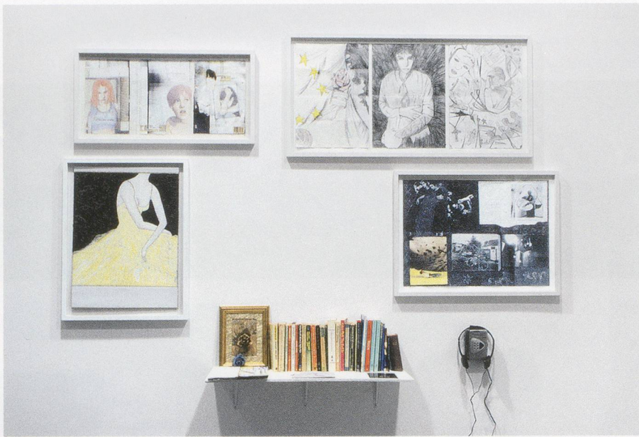
JEREMY DELLER, THE USES OF LITERACY , 1997, mixed-media installation, "Lovecraft," 1998, South London Gallery / DER NUTZEN DES ALPHABETISMUS , Installation, verschiedene Materialien, Installationsansicht.

Street Preachers. The project is hardly a full response, historical or political, to the argument or influence of Hoggart's book. But Deller points to the way a popular music group can lead its listeners to explore art and literature. The band in question was a self-conscious product of the decades following Hoggart's study, when in a way he had been proved wrong: The jukebox boy and the scholarship boy had in fact become one, at least in the broader counter-culture around music.