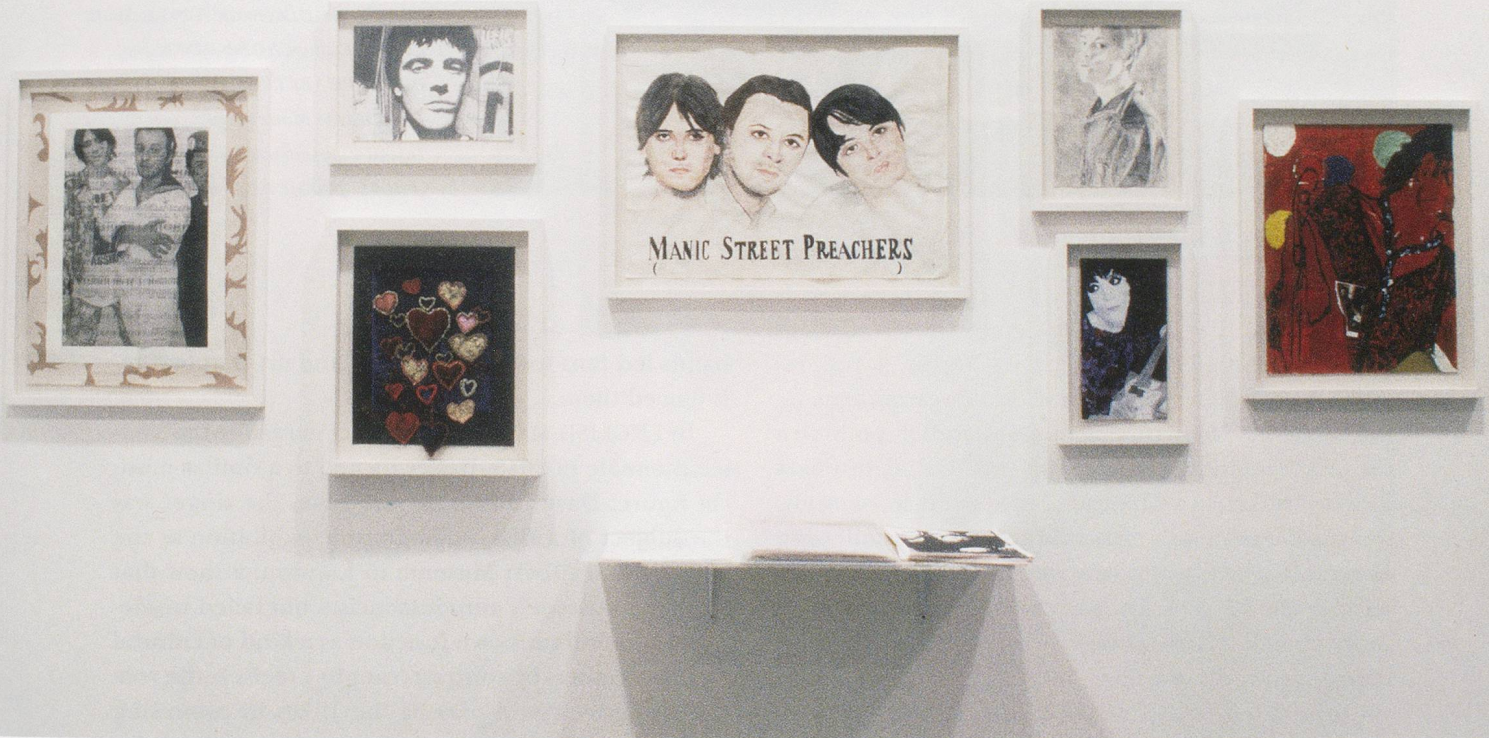
JEREMY DELLER, THE USES OF LITERACY , 1997, mixed-media installation, "Lovecraft," 1998, South London Gallery / DER NUTZEN DES ALPHABETISMUS , Installation, verschiedene Materialien.