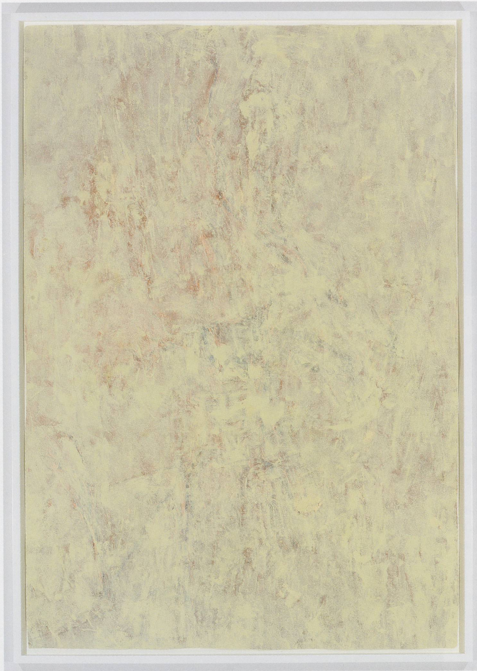
PAMELA ROSENKRANZ, EVERYTHING IS ALREADY DEAD (GATORADE PERFORM 02 COOL BLUE AND CAMEO WHITE), 2012, Ralph Lauren acrylic latex paint, energy drink, inkjet pigment print on Hahnemühle paper, framed, 79 1/2 x 56 5/16" / ALLES IST SCHON TOT (GATORADE PERFORM 02 KALTES BLAU UND KAMEEN-WEISS, Ralph Lauren Acryl-Latexfarbe, Energiedrink, Inkjet-Pigmentdruck auf Hahnemühle-Papier, gerahmt, 202 x 143 cm.