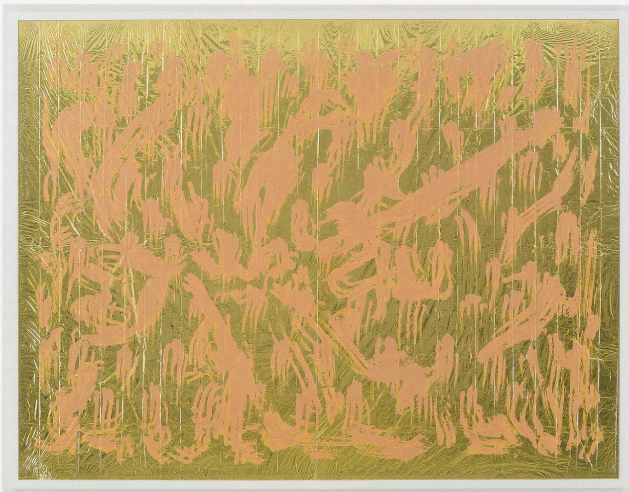
PAMELA ROSENKRANZ, EXPRESS NOTHING (ELIMINATION DUMBLY FEELS), 2011, acrylic on emergency blanket foil, framed, 64 1 / 8 x 83 3 / 8 " / NICHTS AUSDRÜCKEN (DUMPF GEFÜHLTE BESEITIGUNG), Acryl auf Notfalldecken, gerahmt, 162,9 x 211,8 cm.

line, and contemporary art encompasses both animism and the process of reification, both subjectivity and product. Human beings now see themselves as radically relativized to such a degree that the word anthropomorphic could be extended to signify anything with DNA.