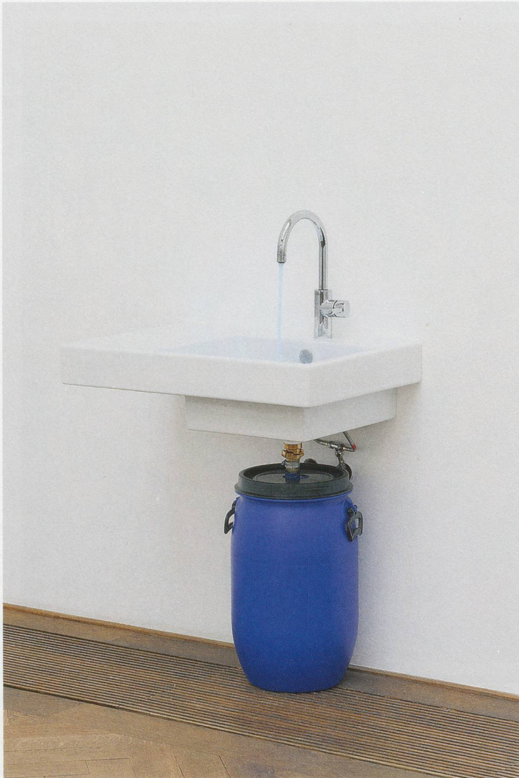
PAMELA ROSENKRANZ, MORE STREAM, 2012, Methylene blue, water, sink, 46 7 / 16 x 29 1 / 2 x 19 11 / 16 ” / MEHR STRÖMUNG, Methylenblau, Wasser, Waschbecken, 118 x 75 x 50 cm.