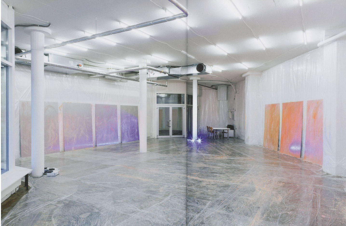
PAMELA ROSENKRANZ, "My Sexuality", 2014, Installation view, Karma International, Zürich / Installationsskizze