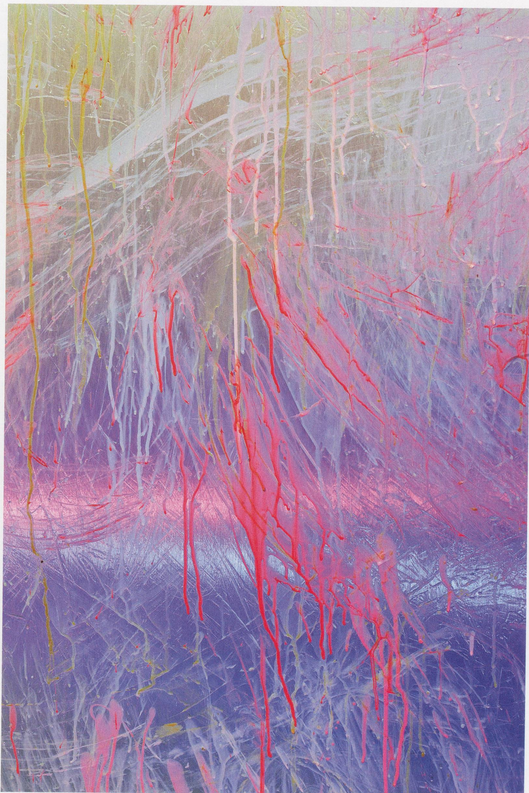
PAMELA ROSENKRANZ, "My Sexuality," 2014, installation view, Karma International, Zürich / Installationsansicht.