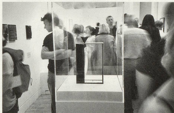
Parkett exhibition, Whitechapel Gallery, London, 2001 / Parkett -Ausstellung.