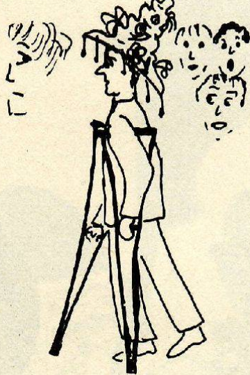
Text + Zeichnung: Barbara Zoller

1 Ein auffälliger Hut: eine annehmbare Entschuldigung für das ewige Angekarrt werden.