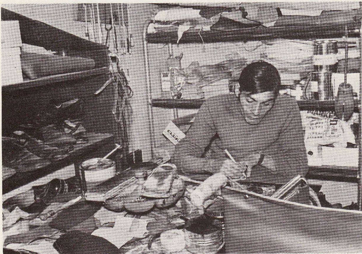
“Comunità Gesù Risorto”, Schuhmacherei

M.-A.: mein mann arbeitet - dank dem gesetz über die beschäftigung behinderter - in einem spital im büro. So erhält er trotz seiner durch die behinderung reduzierten leistung den vollen lohn. Ich selbst erhalte eine kleine rente. So gelingt es uns ohne fremde hilfe durchzukommen, trotz teurer wohnung und ei-