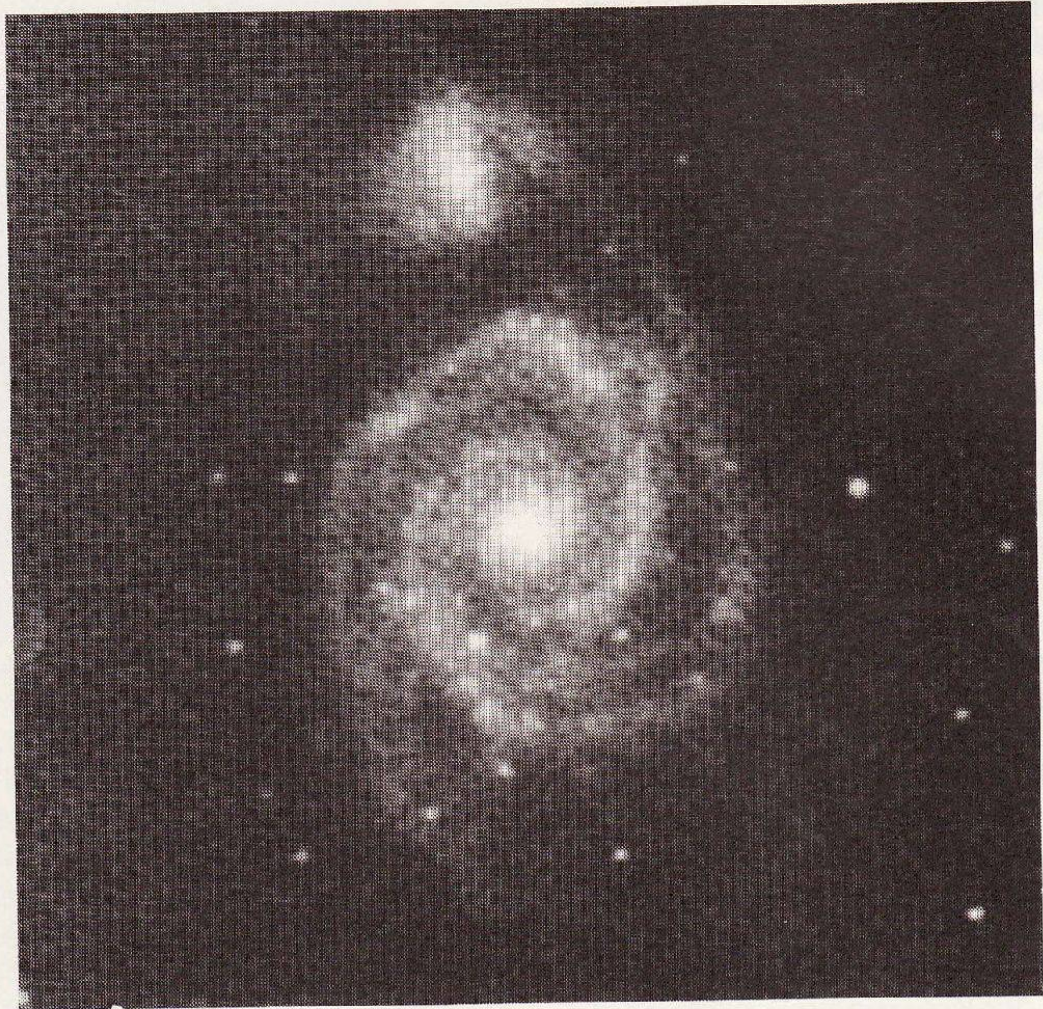
Spiralnebel aufgenommen mit dem Schmidt-Teleskop der Stärnwarte Zimmerwald bei Bern.