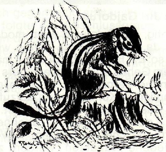
Burunduk oder Gestreiftes Backenhörnchen

Die Fortgeschritteneren unter uns können nach und nach auf solche Sündenböcke verzichten. Allein in eurer Fantasie seht ihr dann die Ratte oder den Hamster in einem Manager, den Wiesel in einem Polizisten, oder das Meerschweinchen, manchmal auch richtiges Schweinchen, in einem Beamten. Sind sie nicht niedlich, die kleingewordenen Dinger. Das nächste Mal werde ich mich mit richtigen Schweinen und Böcken befassen.