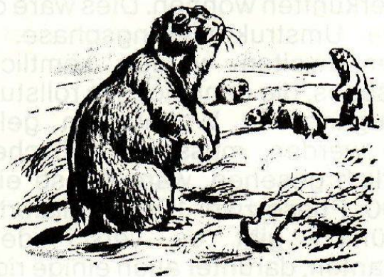
Steppemurmeltier oder Bobak

Auch im neuen Puls werden die Leser zu Wort kommen können, allerdings in etwas beschränkterem Rahmen. Nach dem Motto: eine einzige Meinung ist Silber, sie für sich behalten, ist Gold. ■