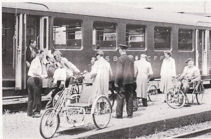
Une époque que Loulou a bien connue.

Je m'intéresse à votre association et vous prie de me faire parvenir la documentation y relative.