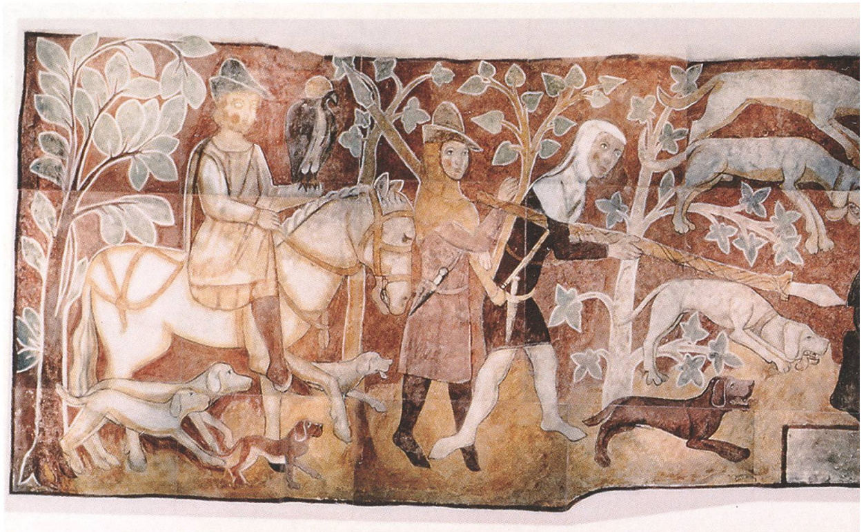
Abb. 4 Darstellung einer Bärenjagd an der Westfront von Schloss Rhäzüns, kurz nach 1350 entstanden.