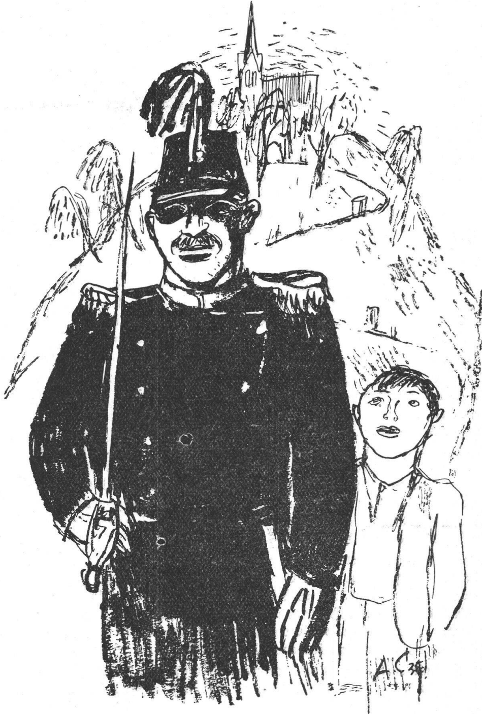
IL CAPITANI DE MATS.

einer Weise die neu war.... Es war für die Zürcher eine Pikanterie, dass ein Bündner, dem man sonst berglerische Schwerblütigkeit nachsagt, hier eine Grazie u. einen schwebenden Humor entwickelte, der eher nach Paris zu weisen schien ».