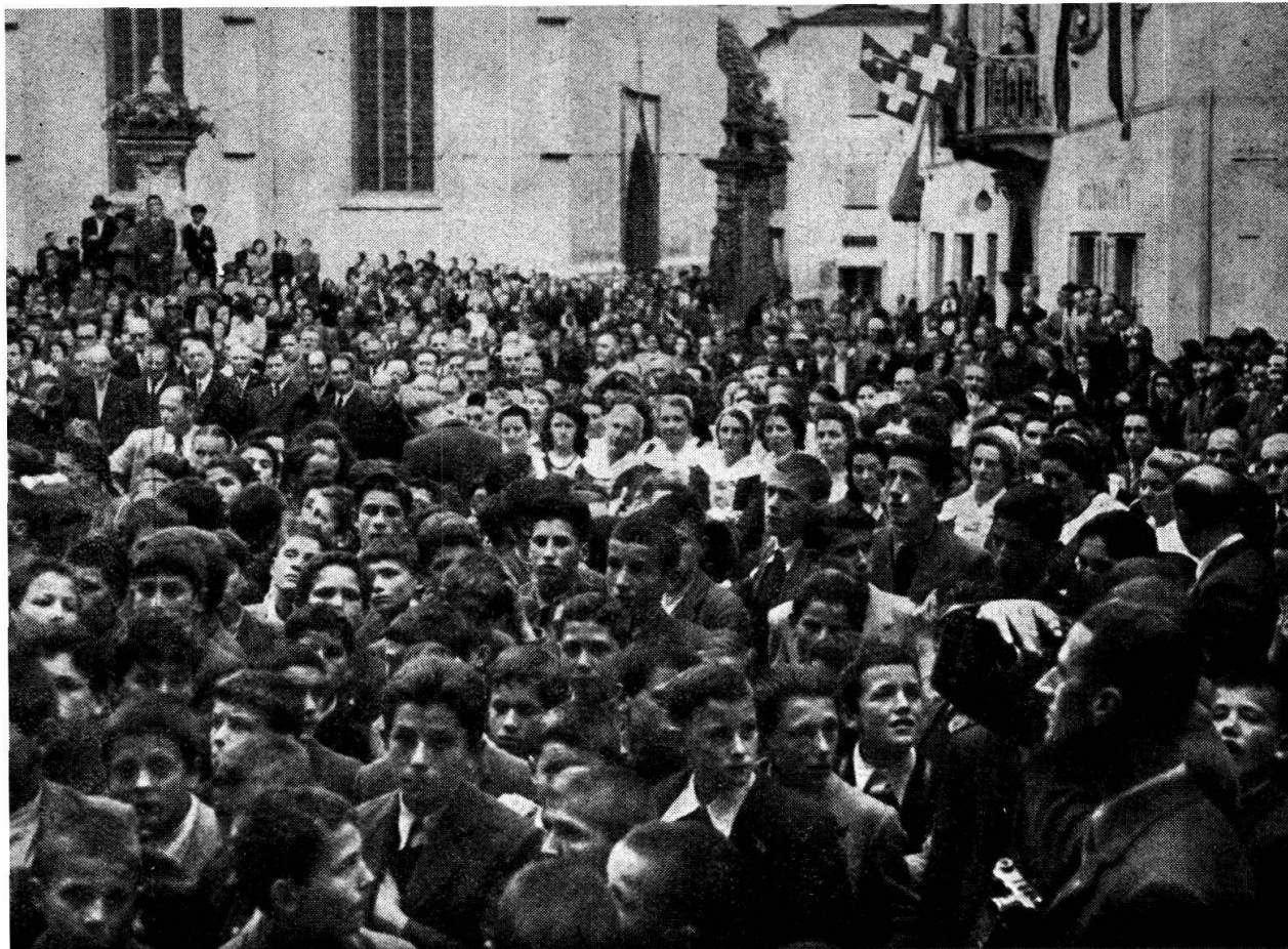
La folla sulla Piazza del Borgo. - Sul davanti le scolaresche

sella, sul disadorno piazzale della Stazione, fuori del Borgo. Brevi, ma cordiali le presentazioni. Si compose il corteggio che, preceduto dalle bandiere — fra cui le bandiere delle quattro Valli — percorse il breve cammino fino all'abitato o alla Piazza grande (della Torre? dell'Arringo?) dove la popolazione gremiva i margini e le finestre dei palazzini imbandierati, e dove, sul lato di settentrione, si era eretto il palco che si staccava dallo sfondo della bandiera svizzera. Suonarono le filarmoniche, cantarono le scolaresche: un gruppo di donne in costume eseguì danze al suono della fisarmonica. Poi il gran silenzio. Improvvisa, si alzò, sonora, la voce del podestà di Poschiavo, C. Rampa.