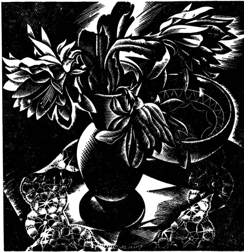
CACTUS (Da „naturamorte“)