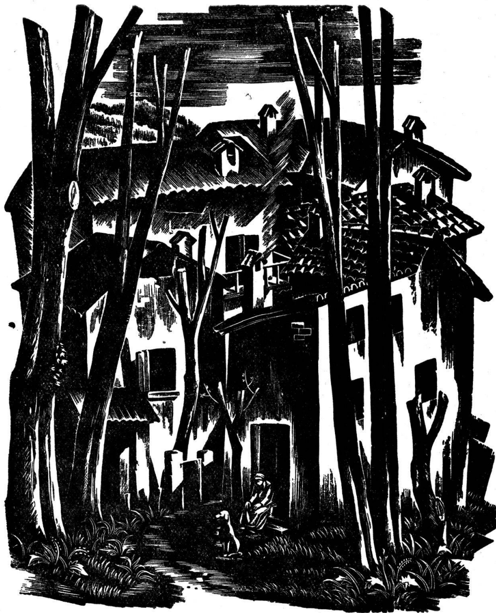
L'ATTESA (Da „Il Ticino dei poveri“)