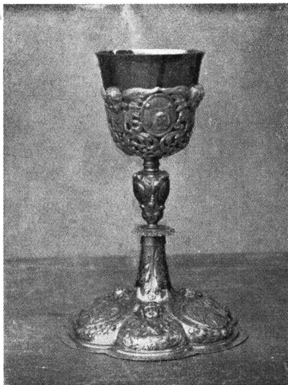
Calice offerto da Enrico Zuccalli alla Parrocchiale di Roveredo

sue preferenze. Le circostanze vollero poi che g'italiani fossero soppiantati dai mesolcinesi, i quali già prima della guerra si erano annidati in quasi tutte le terre meridionali tedesche, perdurando tenaci fino al momento in cui le soldatesche le invasero e tornandovi numerosissimi a guerra finita, particolarmente nella Baviera. Grazie a Enrico Zuccalli s'insediarono anche a Monaco.