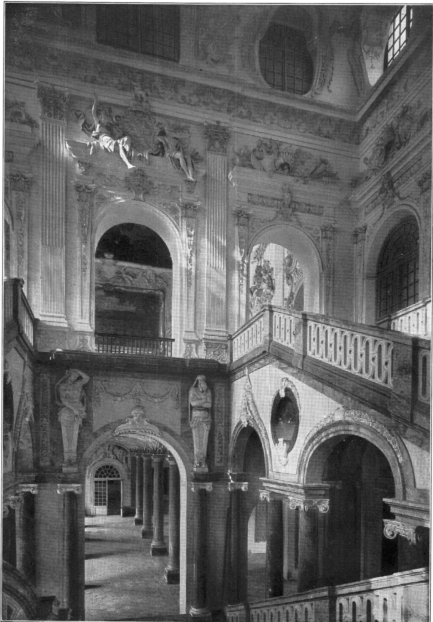
Schleissheim, Interno : la Scala magna.