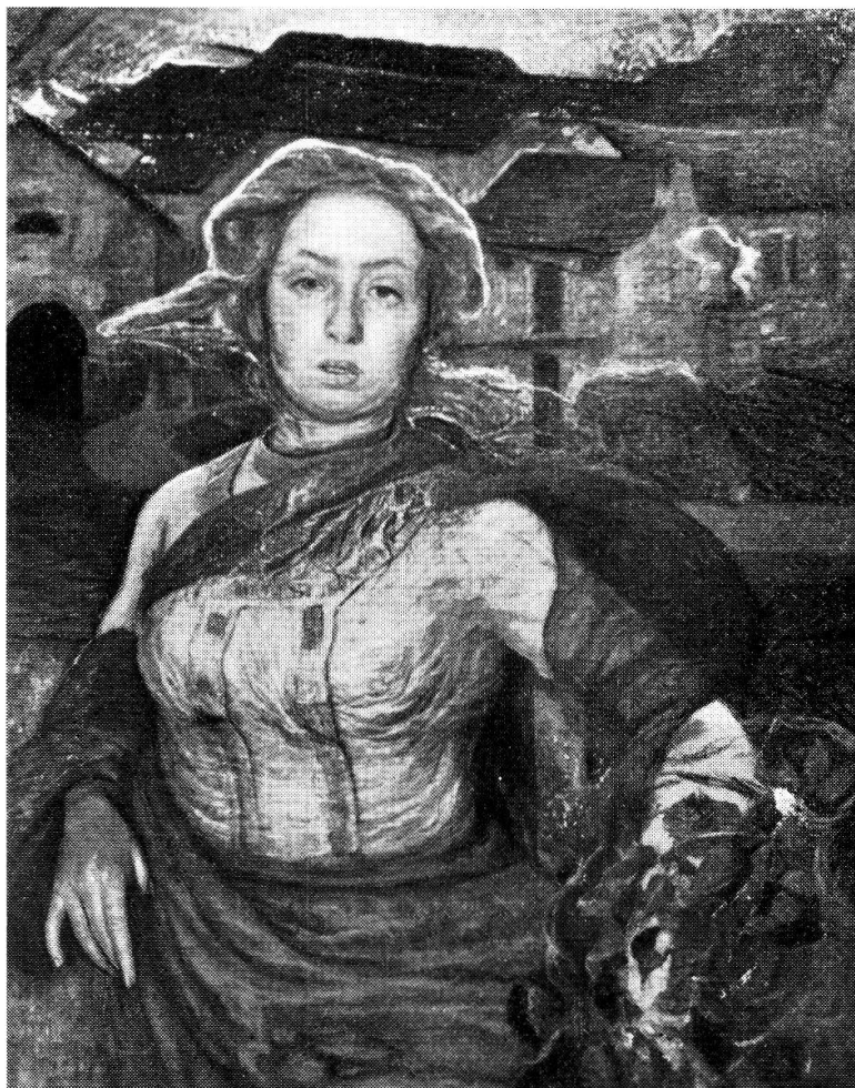
Augusto Sartori - « Popolana » 1908

bianti tipici della sua prima gente appaiono nell'atteggiamento composto del raccoglimento religioso di chi, sospeso e estasiato guarda al prodigioso, o dopo la dura fatica di una vita si adagia nella rassegnazione; l'artista dei paesaggi ispirati dal vero e che tu riconosci, ma nei quali palpita un'atmosfera nuova che ti compenetra, ti prende, e ti dà la calma e la serenità.