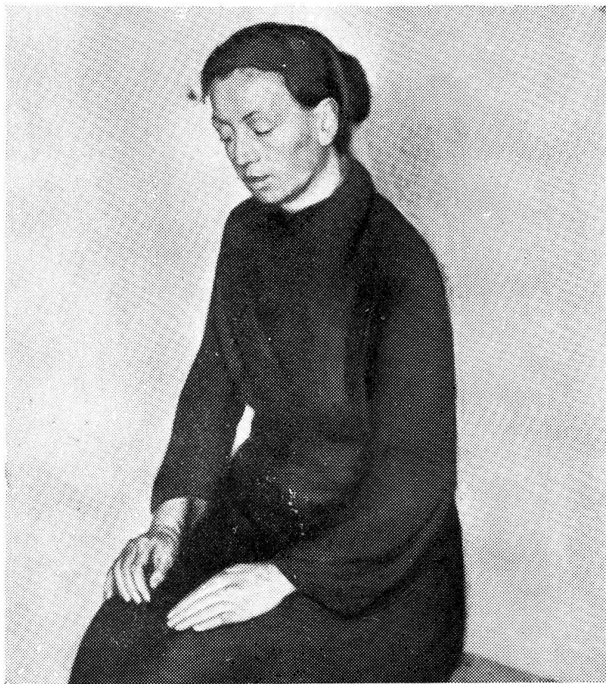
Augusto Sartori - Riposo 1938

Nato il 14 maggio 1880, assolte le scuole di Giubiasco e la scuola di disegno a Bellinzona, frequentò l'Accademia di Belle Arti di Brera a Milano. Sino a pochi anni fa insegnava disegno nelle scuole superiori di Bellinzona. Mandò opere all'Esposizione internazionale di Roma 1916,