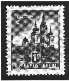
Mariazell, chiesa votiva Francobollo di 1 SL.