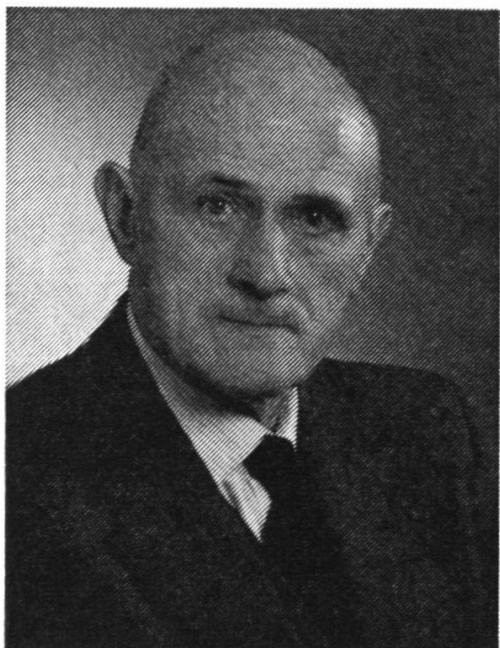
† RODOLFO PLANTA, PIONIERE DELLA GALLERIA DEL SAN BERNARDINO