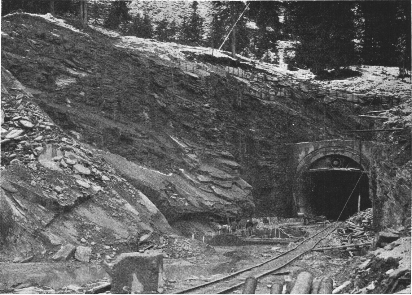
Portale sud del traforo del San Bernardino: gli strati delle falde austridi e pennidiche costituenti le Alpi retiche si immergono verso est e sono disposte in direzione nord-sud. (La fotografia è stata presa all'inizio dei lavori).