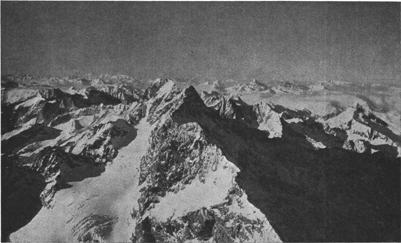
Il Monte della Disgrazia: forma un complesso di rocce serpentinosi molto massicce e resistenti alla potenza delle forze erosive.