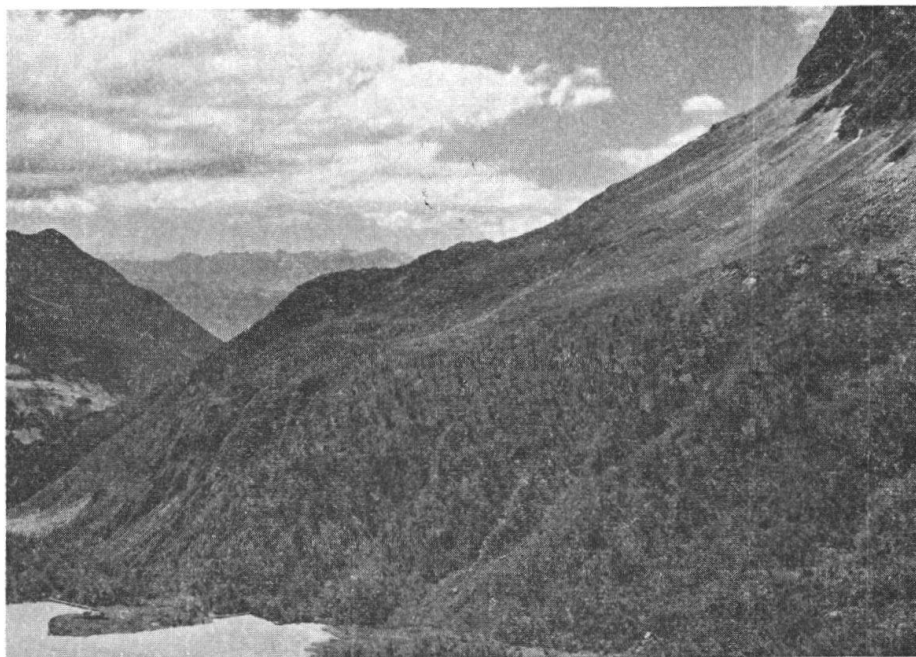
La terrazza dei Pénat, 2100 m., fondovalle pliocenico del sistema erosivo di Aura Freida