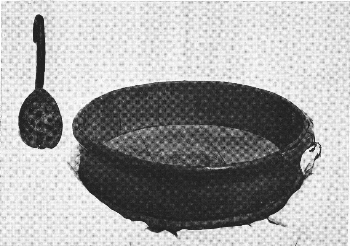
La càspola de la mascarpa — la móta

MÓTA , s. f. conca di legno fatta per lo più con legno di cembro: — gémbro: l'è da témp ch'i dòpra più la móta ind el nòst paés, mi a sómm bé vécc ma ò sempro vedù nomà conch de ramm; motéll s. m. vaso di legno simile alla móta, ma molto più piccolo, in cui si libera il burro dal latticello e gli si dà la forma: sbatt el butér ind el motéll; Guglièl Motéll , scherz. Guglielmo Tell