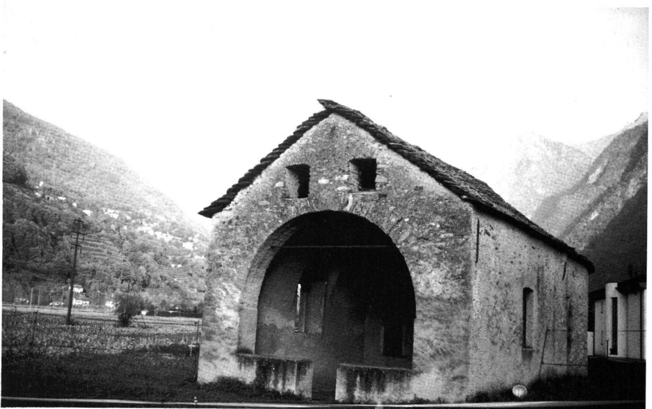
Roveredo, Cappella del Pantano, vicino ai «Tre pilastri»