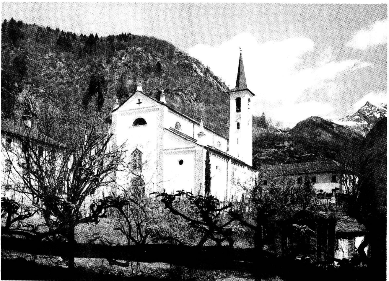
San Vittore, Collegiata dei Santi Giovanni e Vittore

Basilica a tre navate. Coro poligonale eleva-