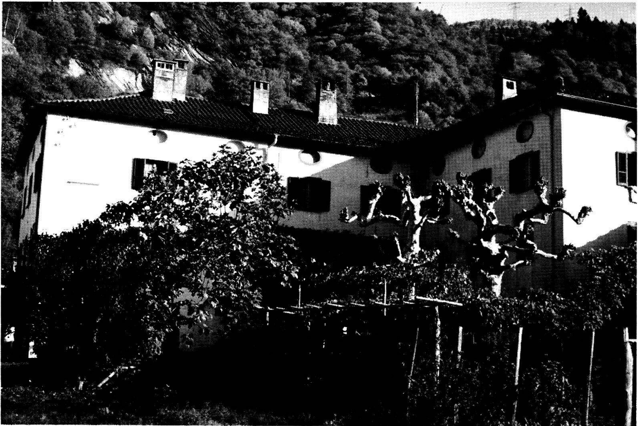
San Vittore, Palazzo Romagnoli (Iseppi)

con un gradino e porta un campaniletto a vela. La campana, databile inizio del secolo XIII, è firmata Vivianus Stemadius .