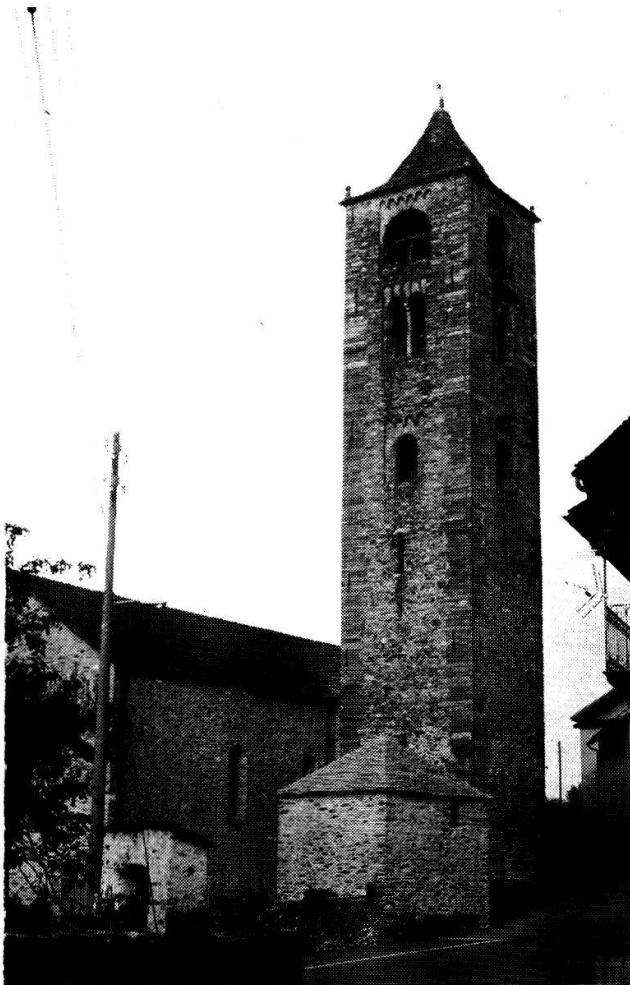
Roveredo, chiesa di S. Giulio (classe Iseppi)

La navata unica, con il soffitto piatto, non dà grande solennità all'interno dell'edificio. Gli altari sono cinque: il maggiore, nel coro, e due laterali, più due nelle cappelle a sud e a