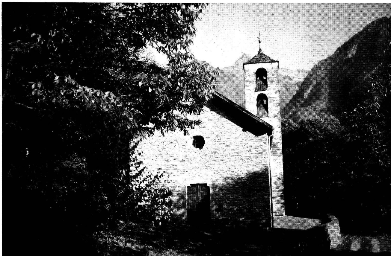
Roveredo, Chiesa di S. Rocco in Carasole

Nelle vicinanze della chiesa della Madonna del Ponte Chiuso, le Figlie della Provvidenza, del Beato Luigi Guanella, assistono, fin dalla fine dell'Ottocento, malati incurabili, poveri andicappati di tutte le età, e, un tempo, ragazzi difficili da educare. Da pochi anni il «Ricovero» ha subito profondi cambiamenti. La scuola interna è stata prima