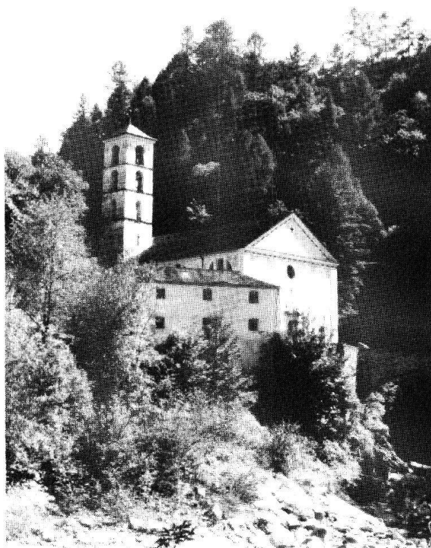
Chiesa Madonna del Ponte Chiuso o Sant'Anna

Situata in romantica posizione, all'imbocco della gola della Traversagna. Il ponte, la chiesa e la casa del sagrestano, formano, con il ponticello e la cappellina di San Carlo