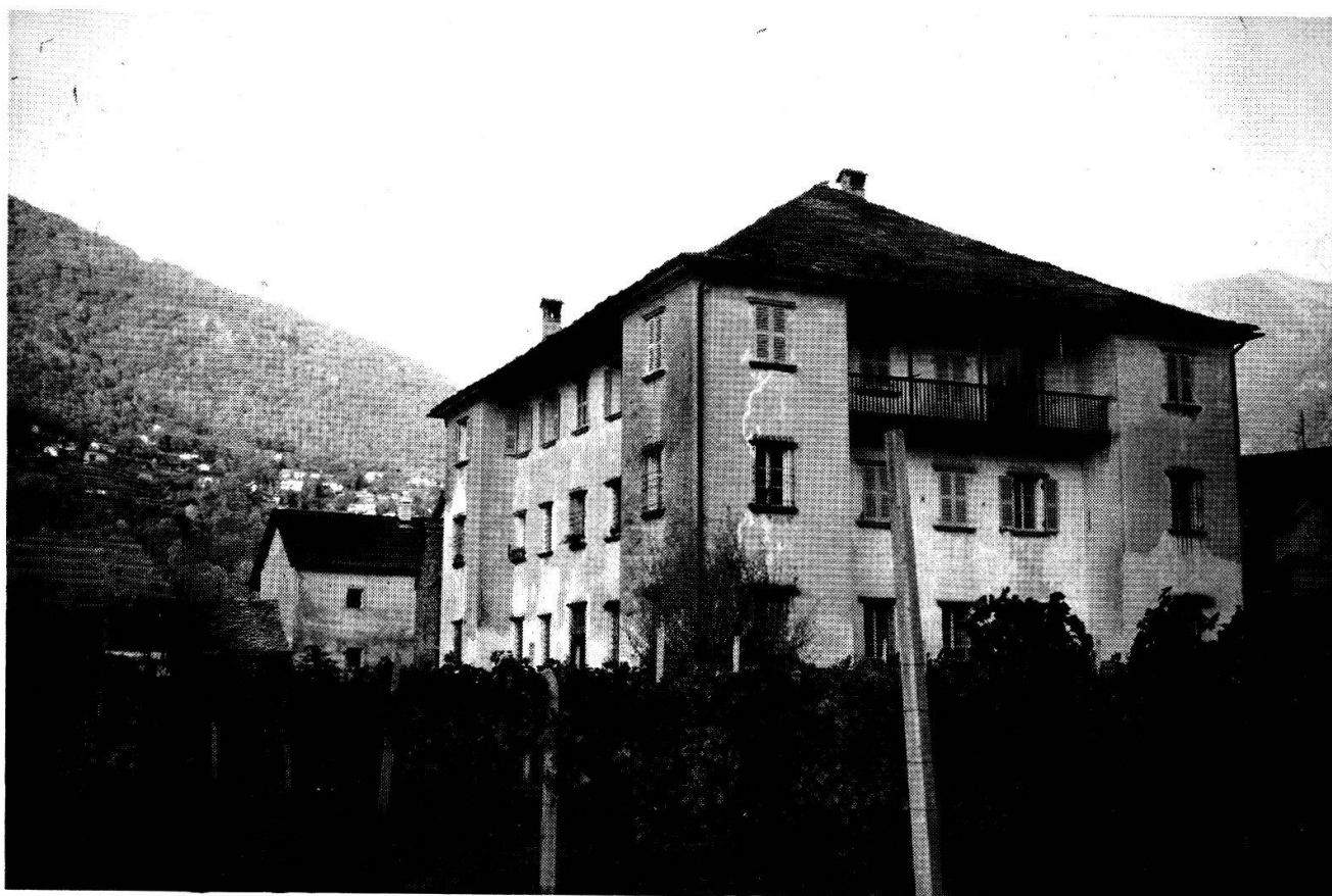
Roveredo, Palazzo Comacio