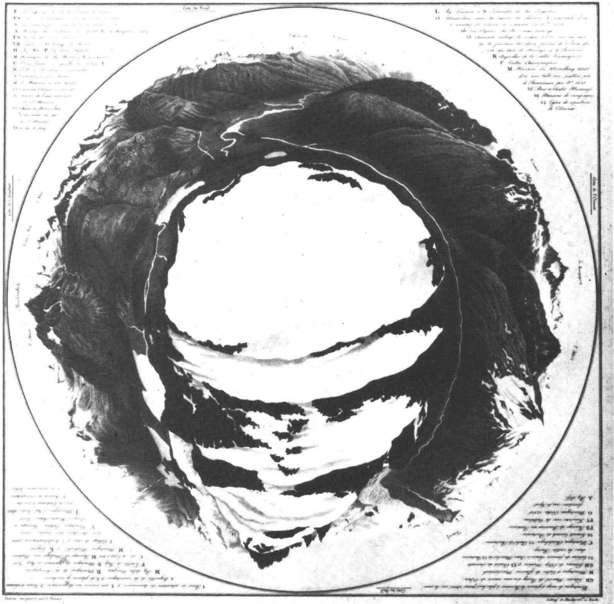
Elias Emanuel Schaffner, panorama delle Alpi Retiche dell'Alta Engadina, 1836, litografia a colori, 42x43 cm, (proprietà privata)

dessiné par le célèbre artiste Schaffner, et gravé par le célèbre graveur de Malloggia, en Suisse, par F. C. Schaffner, 1836.