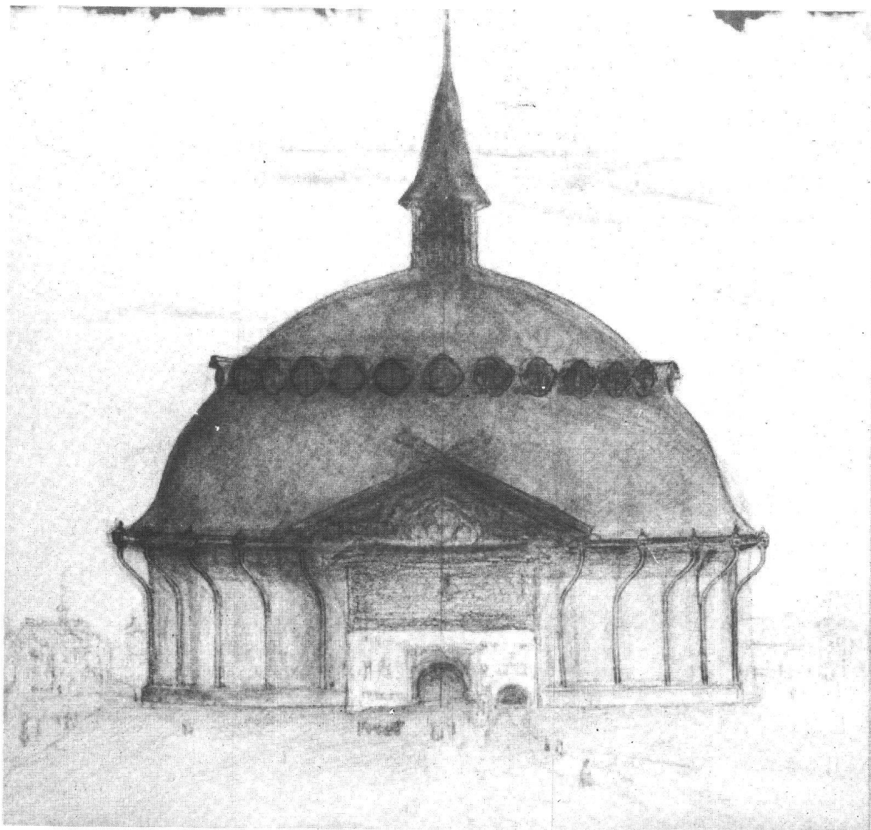
Giovanni Segantini, Padiglione per il panorama dell'Engadina , 1897, carboncino, gesso e matita su carta, 52x 53 cm, Museo Segantini St. Moritz

grafica del maestro, un settore che nelle mostre monografiche finora è stato piuttosto trascurato. La ragione è comprensibile: i disegni conservati sono relativamente pochi perché l'artista stesso non di rado li distruggeva dopo aver eseguito il quadro ad olio; e di tanti che sono finiti in mano privata si è persa ogni traccia. Fra i disegni esposti figurano L'eroe morto , ispirato alla famosa